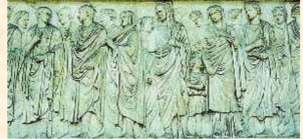
Παράσταση που απεικονίζει άντρες της Συγκλήτου (Ρώμη, βωμός Αυγούστου)

Η σύγκλητος ήταν ένα συμβουλευτικό σώμα, το οποίο αποτελούσαν 300 πατρίκιοι . Ο λαός και οι ύπατοι σέβονταν τη γνώμη της και την έπαιρναν σοβαρά υπόψη τους.