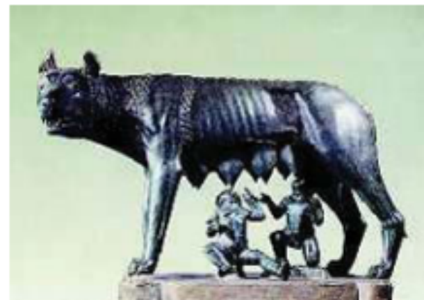
4. Ρέμος και Ρωμύλος, τα δύο μωρά που μεγάλωσαν πίνοντας το γάλα της λύκαινας (Ρώμη, Μουσείο Καπιτωλίου).

Πλούταρχος, Ρωμύλος 2, 3, 6, 8 και 9 αποσπάσματα, (διασκευή)