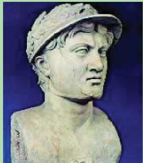
4. Προτομή του Πύρρου (Νάπολη, Εθνικό Αρχαιολογικό Μουσείο)

Ο Πύρρος μέσα στη φασαρία της μάχης έβγαλε την κορυφή της περικεφαλαίας του και την έδωσε σ' έναν από τους φίλους του. Ο ίδιος έχοντας μεγάλη εμπιστοσύνη στο άλογό του, όρμησε εναντίον των εχθρών που έκαναν επίθεση. Ένα δόρυ όμως τον πλήγωσε στο θώρακα, αλλά η πληγή δεν ήταν ούτε μεγάλη ούτε αποτελεσματική. Τότε ο Πύρρος γύρισε εναντίον εκείνου που τον χτύπησε. Αυτός ήταν ένας απλός νεαρός από το Άργος, γιος μιας φτωχής γυναίκας. Η μητέρα του νέου παρακολουθούσε τη μάχη από τη στέγη. Μόλις είδε το γιο της να παλεύει με τον Πύρρο, φοβήθηκε για τη ζωή του. Πήρε λοιπόν στα χέρια της ένα κεραμίδι και το πέταξε στον Ηπειρώτη βασιλιά. Το κεραμίδι έπεσε στο κεφάλι του Πύρρου και τον σκότωσε.