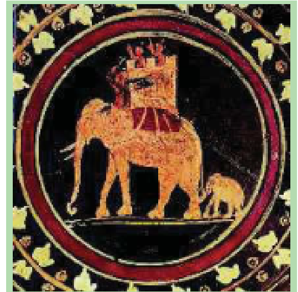
2. Πολεμική σκηνή από τις εκστρατείες του Πύρρου

Ο Κινέας, ενώ ο Πύρρος ετοιμαζόταν να εκστρατεύσει στην Ιταλία, άνοιξε μαζί του συζήτηση: «Πύρρε, λένε πως οι Ρωμαίοι είναι γενναίοι πολεμιστές, αν όμως τους νικήσουμε, σε τι θα μας χρησιμέψει η νίκη μας;» Ο Πύρρος είπε: «Αν νικηθούν οι Ρωμαίοι, θα κατακτήσουμε την πλούσια Ιταλία». Ο Κινέας είπε στη συνέχεια: «Τι θα κάνουμε, άμα κατακτήσουμε την Ιταλία;» Ο Πύρρος του απάντησε: «Θα κατακτήσουμε τη Σικελία, που είναι κοντά και μας απλώνει τα χέρια». «Τότε θα τελειώσει η εκστρατεία μας», είπε ο Κινέας. Ο Πύρρος, που δεν είχε καταλάβει πού πήγαινε την κουβέντα ο Κινέας, είπε: «Αυτή θα είναι η αρχή για νέα κατορθώματα, πιο μεγάλα». «Είναι λοιπόν φανερό πως με τέτοια δύναμη που θα έχουμε και τη Μακεδονία θα καταλάβουμε και την Ελλάδα θα κυβερνήσουμε. Και όταν τα πετύχουμε όλα αυτά τι άλλο θα κάνουμε;» ρώτησε ο Κινέας. Ο Πύρρος, αφού γέλασε, είπε: «Θα έχουμε πολύ χρόνο για ξεκούραση και διασκέδαση και το ποτήρι μας θα είναι γεμάτο κάθε μέρα». Τότε ο Κινέας, που έφερε τη συζήτηση εκεί που ήθελε, είπε: «Τι μας εμποδίζει λοιπόν και τώρα να γεμίζουμε το ποτήρι μας και να κάνουμε ευχάριστη παρέα, αφού χωρίς κόπους έχουμε όλα αυτά που θα προσπαθήσουμε να αποκτήσουμε με μεγάλες θυσίες και αφού προκαλέσουμε και πάθουμε πολλά κακά;»