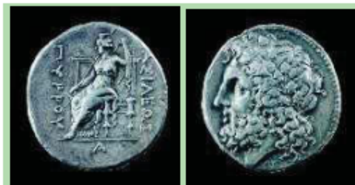
3. Νόμισμα της εποχής του Πύρρου με παράσταση του Δία. Στην άλλη όψη διαβάζουμε το όνομα του βασιλιά (Λονδίνο, Βρετανικό Μουσείο).