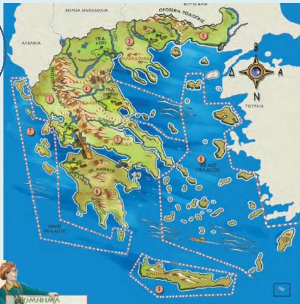
Χάρτης 2: Γεωμορφολογικός χάρτης της Ελλάδας

Ο χάρτης αυτός είναι γεωμορφολογικός και μας δίνει πληροφορίες για τα βουνά, τις πεδιάδες, τα ποτάμια, τις λίμνες, τις θάλασσες, τους κόλπους, τις χερσονήσους και τα ακρωτήρια που υπάρχουν στο καθένα γεωγραφικό διαμέρισμα.