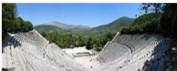
Το αρχαίο θέατρο της Επιδαύρου

Τα κύρια μέρη του αρχαίου ελληνικού θεάτρου ήταν η σκηνή , η ορχήστρα και το κοίλον .