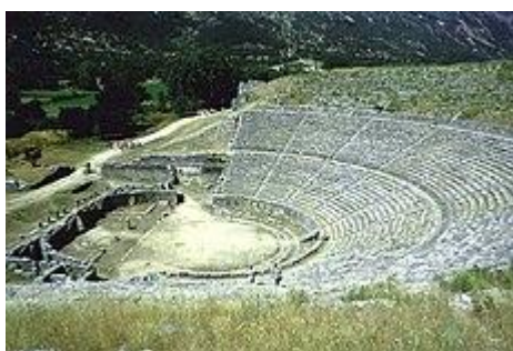
Το αρχαίο θέατρο της Δωδώνης

Το αρχαίο ελληνικό θέατρο , θεσμός της αρχαιοελληνικής πόλης κράτους, διδασκαλία και τέλεση θεατρικών παραστάσεων, επ' ευκαιρία των εορτασμών του Διονύσου, αναπτύχθηκε στα τέλη της αρχαϊκής περιόδου και διαμορφώθηκε πλήρως κατά την κλασική περίοδο -κυρίως στην Αθήνα. Χρησίμευε για θρησκευτικές τελετουργίες, αγώνες μουσικής και ποίησης, θεατρικές παραστάσεις, συνελεύσεις του δήμου ή της βουλής της πόλης-κράτους , ακόμα και ως αγορά.