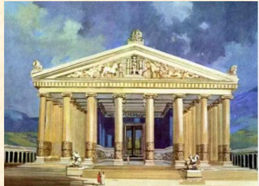
Ναός Αρτέμιδος – Έφεσος