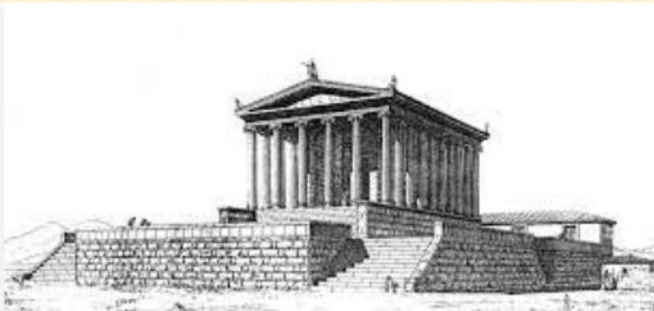
Ναός Αθηνάς - αρχαία Μίλητος

Στις αποικίες οι Έλληνες προόδευσαν . Έχτισαν ναούς και έκαναν μεγάλα δημόσια έργα . Γνώρισαν άλλους λαούς και ανέπτυξαν με αυτούς σχέσεις , χωρίς όμως να ξεχάσουν την καταγωγή τους.