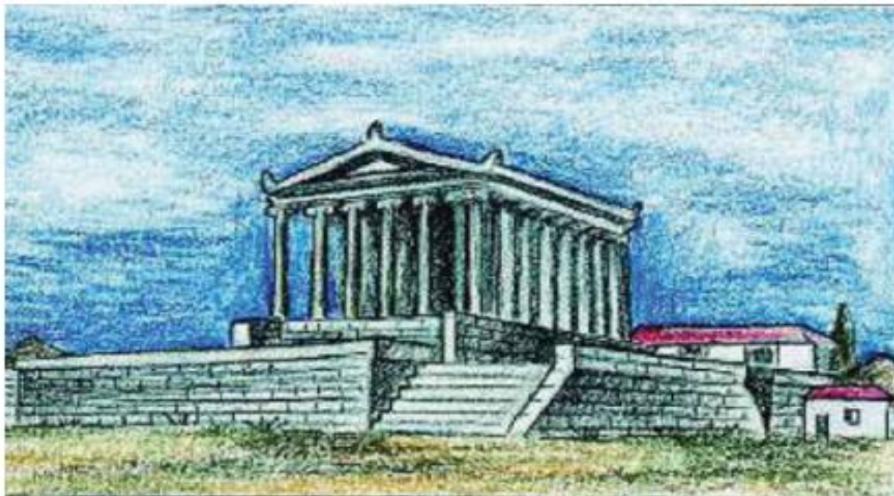
3. Αναπαράσταση του ναού της Αθηνάς που βρισκόταν στην αρχαία Μίλητο.

Ας αφήσουμε τους αποίκους να μοιράσουν μεταξύ τους τη γη και τα σπίτια. Στη μοιρασιά όμως πρέπει να σκεφτούν ότι αυτός που του τυχαίνει το χωράφι, να θεωρεί ότι το χωράφι του ανήκει σ' ολόκληρη την πόλη, γιατί είναι η πατρίδα του και πρέπει να την περιποιείται πιο πολύ απ' ό,τι μια μητέρα τα παιδιά της. Η πατρίδα είναι θεά, βασίλισσα των ανθρώπων. Έτσι πρέπει να σκέφτονται οι άποικοι και για τους θεούς.