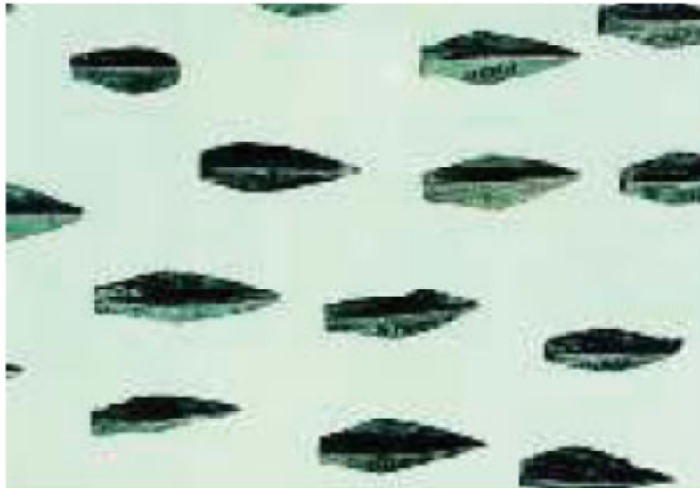
4. Αιχμές περσικών βελών που βρέθηκαν στην περιοχή των Θερμοπυλών.

Η μάχη συνεχίστηκε μέχρι που έφτασαν οι εχθροί με τον Εφιάλτη. Όταν το κατάλαβαν αυτό οι Έλληνες, όλα άλλαξαν. Υποχώρησαν στο πιο στενό σημείο, μπήκαν μέσα στο τείχος και πήγαν και πήραν θέση στο μικρό λόφο, εκτός από τους Θηβαίους. Σ' αυτό το μέρος έδωσαν μάχη με τα μαχαίρια, που τους είχαν απομείνει, αλλά και με τα χέρια και με τα δόντια. Όλους αυτούς τους σκότωσαν με τα πυκνά βέλη τους οι Πέρσες, καθώς τους είχαν περικυκλώσει απ' όλες τις μεριές.