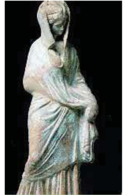
5. Ταναγραία κόρη (Μουσείο Λούβρου)

Οι Ταναγραίες κόρες είναι χαριτωμένα πήλινα αγαλματάκια νεαρών γυναικών. βρέθηκαν μέσα σε τάφους στην Τανάγρα της Βοιωτίας σε ανασκαφές που έγιναν από το 1870-1889. Οι κυρίως όμως Ταναγραίες κόρες άρχισαν να κατασκευάζονται από τα μέσα του 4ου αιώνα π.Χ. μέχρι τον 3ο αι. π.Χ.. Τα αγαλματάκια αυτά παρουσιάζουν τις νεαρές Ταναγραίες σε όλες τους τις εμφανίσεις. Ο πιο συνηθισμένος τύπος είναι αυτός με τα ρούχα του περιπάτου, που ήταν χιτώνας και ιμάτιο τυλιγμένα γύρω από το σώμα και τα χέρια. Άλλες φοράνε καπέλο ή κρατάνε βεντάλια ή άλλα αντικείμενα. Άλλες κάθονται σε βράχους σκεπτικές, άλλες παίζουν ή χορεύουν, πότε μόνες και πότε με συντροφιά. Τα αγαλματάκια αυτά ήταν χρωματισμένα με πολύ ζωηρά χρώματα. Τα ρούχα σε πολλά από αυτά είναι γαλάζια ή ροζ, τα μαλλιά ξανθά και τα παπούτσια κόκκινα. Καταπληκτικό είναι πως, παρόλο που μοιάζουν μεταξύ τους οι Ταναγραίες, δεν υπάρχουν ούτε δύο αγαλματάκια εντελώς ίδια.