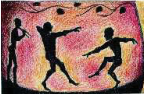
4. Χορευτές και μουσικός με αυλό• αναπαράσταση από αγγείο

Δεν μπορώ να κρύψω τη σοφή και συνάμα ελληνική διαγωγή του Ισμηνία από τη Θήβα. Όταν πήγε στην Περσία ως απεσταλμένος της πατρίδας του, θέλησε να δει από κοντά το μεγάλο βασιλιά. Ο υπηρέτης του βασιλιά τού είπε: «Ξένε Θηβαίε, υπάρχει νόμος περσικός, σύμφωνα με τον οποίο αυτός που θα δει το βασιλιά και θα του μιλήσει, πρέπει πρώτα να τον προσκυνήσει. Αν θέλεις λοιπόν και συ να τον συναντήσεις, να κάνεις το ίδιο, διαφορετικά θα πεις ό,τι θέλεις σε μένα». Τότε ο Ισμηνίας είπε: «οδήγησέ με». Αφού πλησίασε