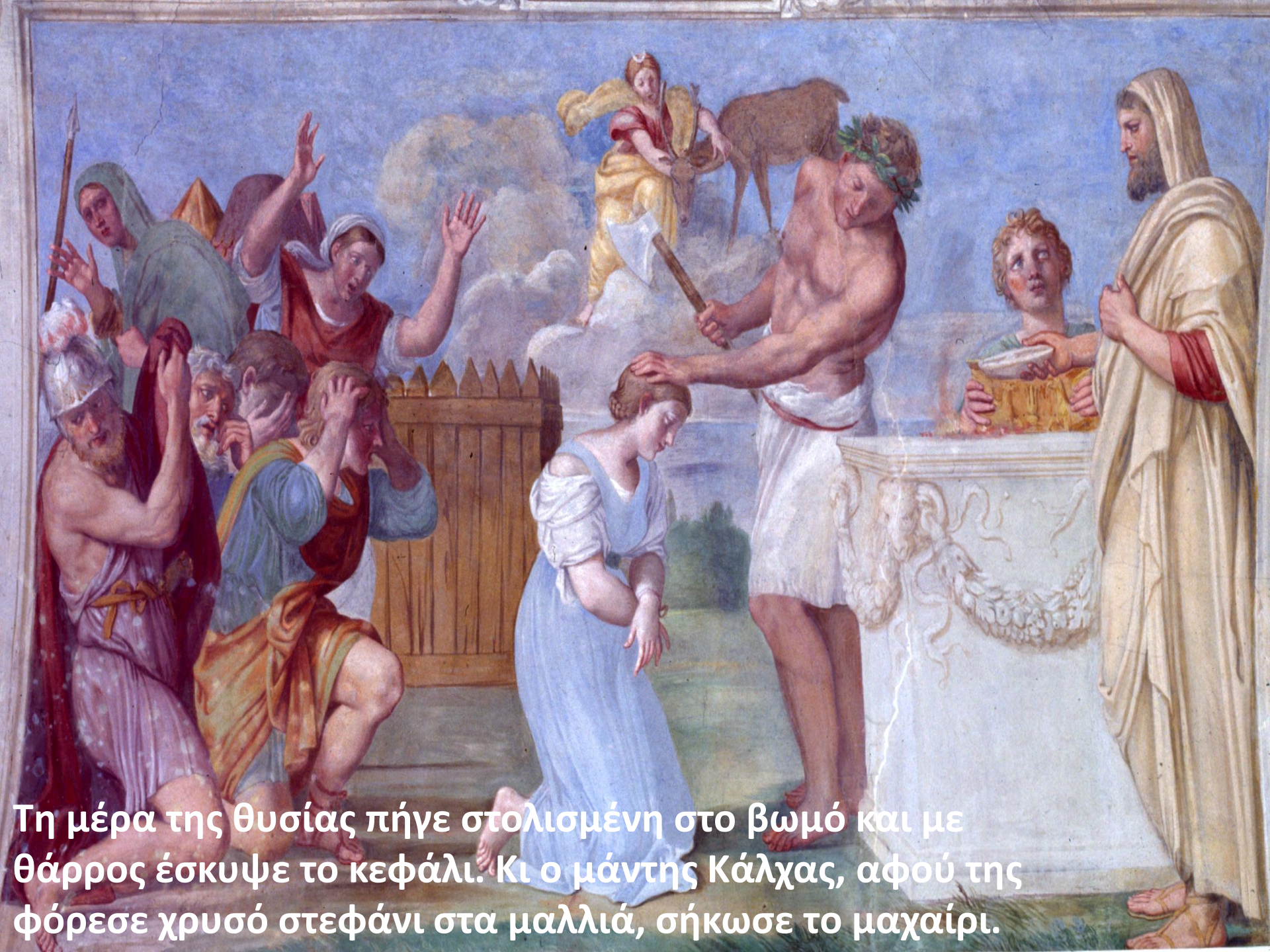
Τη μέρα της θυσίας πήγε στολισμένη στο βωμό και με θάρρος έσκυψε το κεφάλι. Κι ο μάντης Κάλχας, αφού της φόρεσε χρυσό στεφάνι στα μαλλιά, σήκωσε το μαχαίρι.