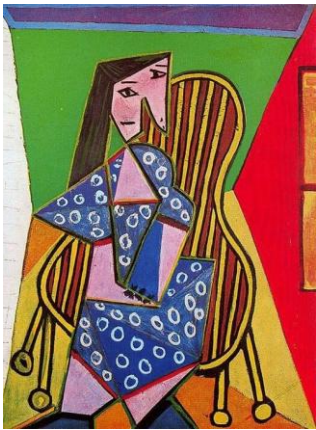
Γυναίκα σε πολυθρόνα (1941)