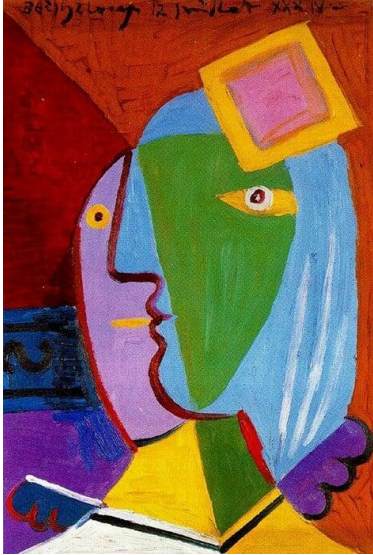
Γυναίκα με καπέλο (1934)

Στο παρακάτω πλαίσιο φτιάξε ένα δικό σου έργο χρησιμοποιώντας όσα περισσότερα γεωμετρικά σχήματα μπορείς.