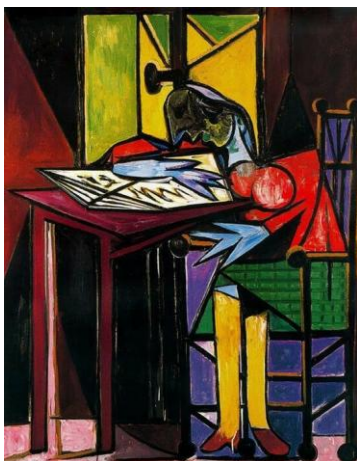
Γυναίκα που διαβάζει (1935)