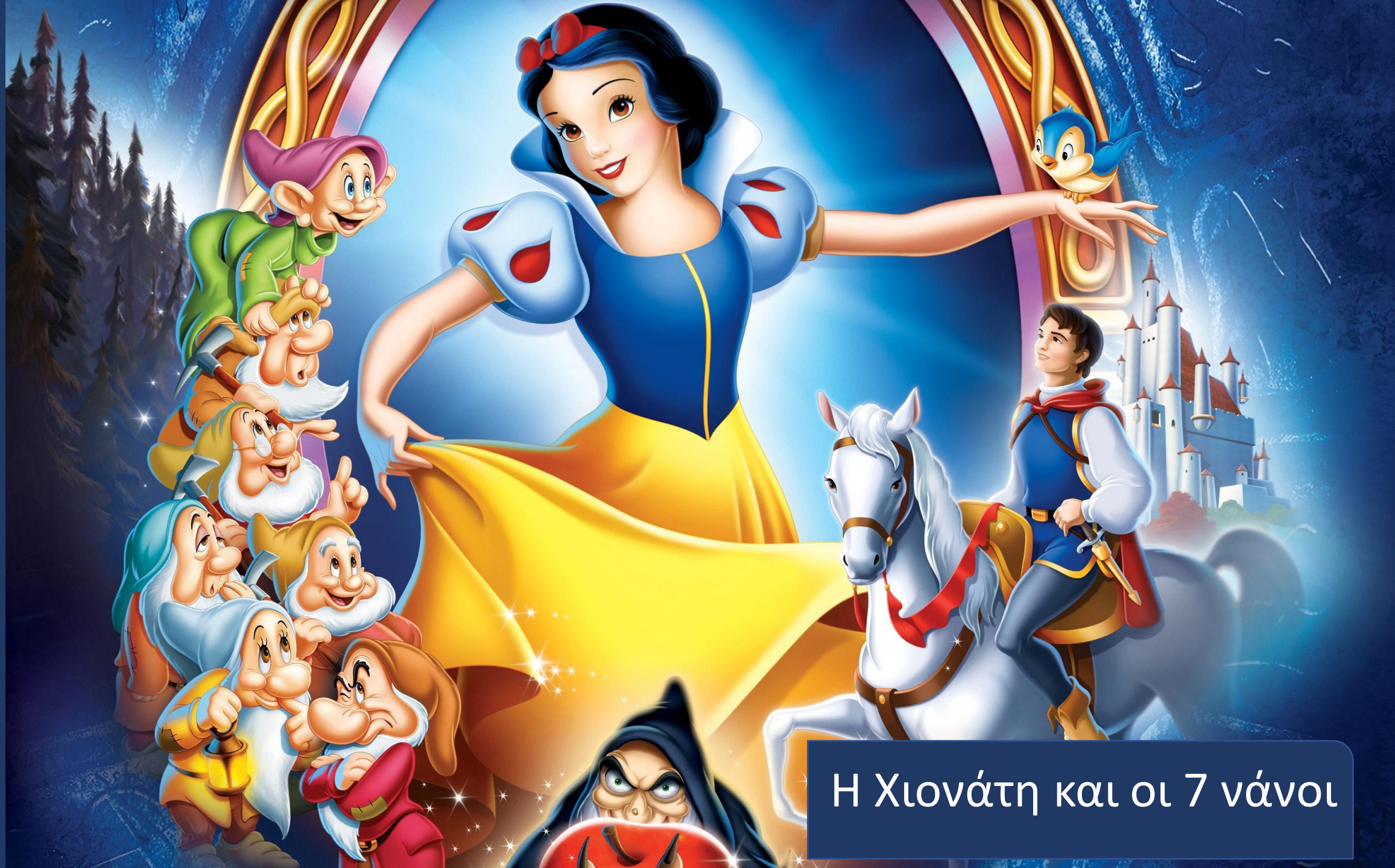
Η Χιονάτη και οι 7 νάνοι