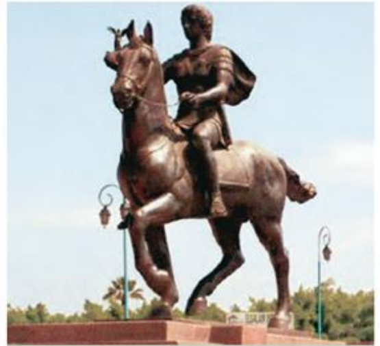
2. Αγαλμα του Μ. Αλεξάνδρου που βροίσκεται στην Αλεξάνδρεια της Αιγύπτου

Ν. Πολίτης, Παραδόσεις του ελληνικού λαού, τόμος Α', σ. 387 (διασκευή)