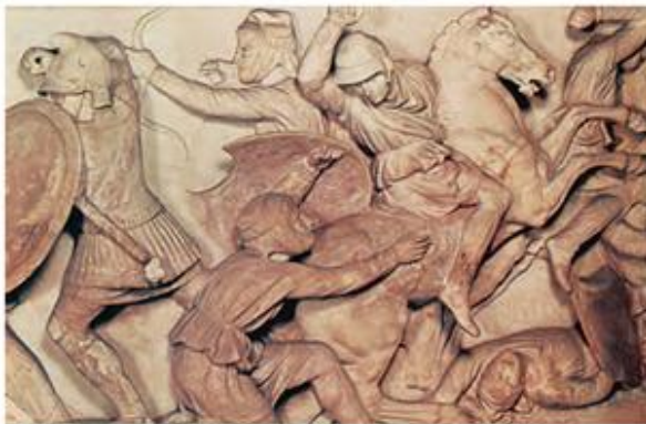
3. Τμήμα από σαοκοφάγο του Μ. Αλεξάνδρου (Μουσείο Κωνσταντινούπολης)

Όταν ο Μ. Αλέξανδρος έχασε κάθε ελπίδα να σωθεί, έβγαλε το δαχτυλίδι του και το έδωσε στον Περδίκκα. Οι φίλοι του τότε τον ρώτησαν σε ποιον αφήνει τη βασιλεία. Αυτός απάντησε: «Στον καλύτερο». Στη συνέχεια πρόσθεσε αυτές τις τελευταίες λέξεις: «Προβλέπω πως οι αγώνες που θα γίνουν προς τιμή μου, μόλις πεθάνω, θα είναι μια μεγάλη μάχη των φίλων μου». Λόγια που σύντομα βγήκαν αληθινά. Μετά ξέσπασαν μεγάλοι αγώνες για τη βασιλεία.