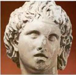
3. Προτομή του Μ. Αλεξάνδρου (Πέλλα, Αρχαιολογικό Μουσείο)

Ο Αλέξανδρος, μόλις έφτασε στον Γόρδιο, θέλησε να ανέβει στην ακρόπολη, για να δει την άμαξα και τον δεσμό του ζυγού της. Για την άμαξα διαδιδόταν ο εξής μύθος: όποιος κατάφερνε να λύσει τον δεσμό από τον ζυγό της άμαξας ήταν ορισμένος από τη μοίρα να γίνει κύριος της Ασίας. Η ταινία ήταν φτιαγμένη από φλούδα κρυνιάς* και δεν μπορούσε κανένας να ξεχωρίσει ούτε την αρχή ούτε το τέλος. Ο Αλέξανδρος δεν ήθελε να τον αφήσει άλυτο, μήπως αυτή του η αδυναμία προκαλέσει κακή εντύπωση σε πολλούς. Έτσι τον κτύπησε, όπως λένε μερικοί, με το ξίφος του, τον έκοψε και είπε ότι λύθηκε πια ο δεσμός. Άλλος ιστορικός λέει πως τον έλυσε διαφορετικά.