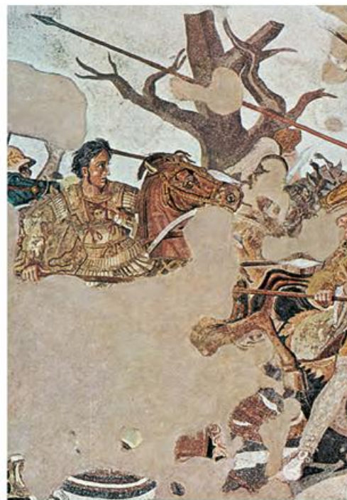
4. Ο Μ. Αλέξανδρος στη μάχη στην Ισσό. Λεπτομέρεια από ψηφιδωτό (Νάπολη, Αρχαιολογικό Μουσείο)

*ο Περδίκας: μεγάλος στρατηγός του Αλεξάνδρου Πλούταρχος, Αλέξανδρος, 15 (διασκευή)