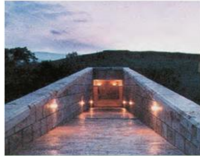
6. Η είσοδος στον χώρο των βασιλικών τάφων που ανακαλύφθηκαν στη Βεργίνα

Πάπυρος Λαρούς Μπριτάνικα, τόμος 14ος, σ. 91-92