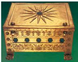
5. Χρυσή λάρνακα με το έμβλημα των Μακεδόνων βασιλιάδων (Βεργίνα, κτίριο προστασίας βασιλικών τάφων)

Ο Αλέξανδρος σ' έναν λόγο του λέει στους Μακεδόνες: