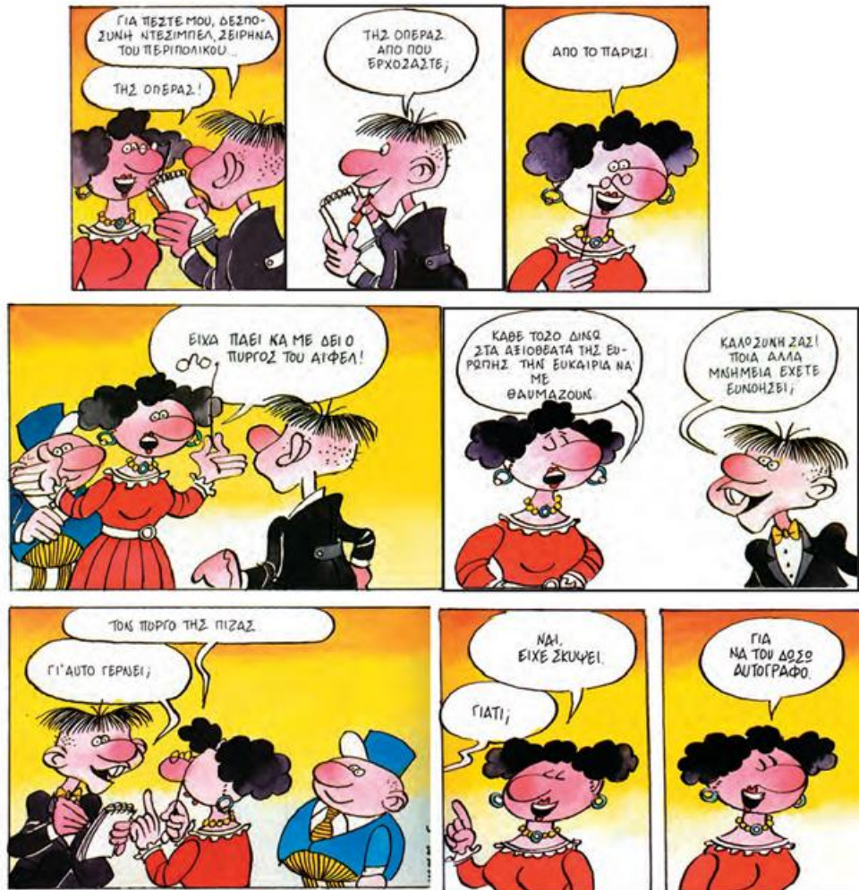
Ευγένιος Τριβιζάς, Φρουτοπία-4, Ο μανάβης και η σοπράνο , εκδ. Πατάκη, Αθήνα, 1994, σκίτσα Ν. Μαρουλάκης

ερίτημη: σεβαστή πριμαντόνα: η πρωταγωνίστρια μουσικού θεάτρου όπερα: μελοποιημένη θεατρική παράσταση δεσποσύνη: δεσποινίδα