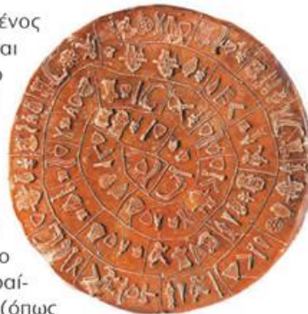
Εγκυκλοπαίδεια Πατάκης-Oxford, τόμος 15ος, εκδ. Πατάκη, Αθήνα, 2001

Χρησιμοποιήθηκαν 45 διαφορετικά σύμβολα που χωρίζονται από κάθετες γραμμές. Από το πλήθος των διαφορετικών συμβόλων συμπεραίνουμε ότι είναι πολλά για να είναι γράμματα (όπως αυτά που χρησιμοποιούμε σήμερα), αλλά και λίγα για να είναι ιδεογράμματα (όπως έχει, π.χ., η κινέζικη γραφή), οπότε πρόκειται μάλλον για συλλαβές.