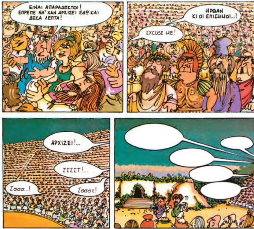
Οι κωμωδίες του Αριστοφάνη σε κόμικ: Όρνιθες, διασκευή-κείμενα: Τ. Αποστολίδης, σκίτσα Γ. Ακοκαλίδης, εκδ. γράμματα, Αθήνα, 1999