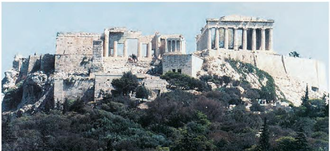
2. Αποψη της Ακρόπολης

Πάνω στην Ακρόπολη στήθηκαν λαμπρά μνημεία , που και σήμερα γνωρίζουν παγκόσμιο θαυμασμό. Ο Περικλής ανάθεσε στον φίλο του, τον Φειδία , να παρακολουθεί προσωπικά τα έργα.