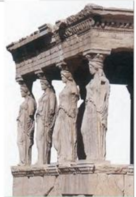
3. Το Ερέχθειο. Οι Καρυάτιδες κρατούν με το κεφάλι τους τη στέγη του ναού.