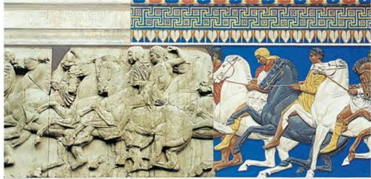
4. Τμήμα από ζωφόρο του Παρθενώνα που βρίσκεται στο Βρετανικό Μουσείο. Η αναπαράσταση δείχνει ότι αρχικά τα μάρμαρα ήταν καλυμμένα με χρώμα.