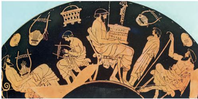
2. Σχολείο στην αρχαία Αθήνα. Ο κιθαριστής και ο γραμματιστής κάνουν μάθημα. Στην άκρη δεξιά κάθεται ο παιδαγωγός. Απεικόνιση από ερυθρόμορφο αγγείο του 5ου αιώνα π.Χ. (Αρχαιολογικό Μουσείο του Βερολίνου)

στο σπίτι παίζοντας διάφορα παιχνίδια. Μετά από αυτή την ηλικία οι γονείς τα έστελναν με τη συνοδεία ενός παιδαγωγού στον γραμματιστή. Εκεί θα μάθαιναν να διαβάζουν, να γράφουν και να λογαριάζουν. Ο κιθαριστής τούς μάθαινε να παίζουν κιθάρα και λύρα.