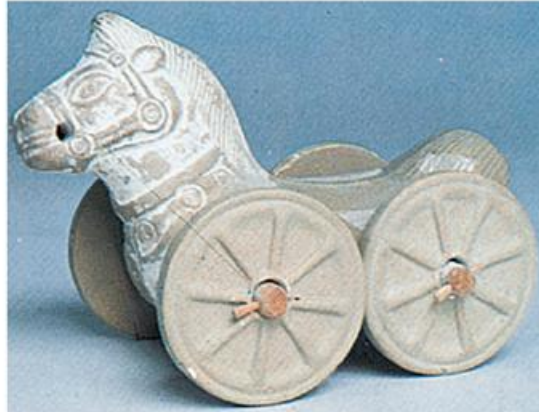
4. Πήλινο αλογάκι (Αρχαιολογικό Μουσείο Αθηνών)

Αφού διαβάσετε το κείμενο, να καταγράψετε τα παιχνίδια που έπαιζαν τα παιδιά και μετά να πείτε ποια από αυτά παίζετε κι εσείς σήμερα.