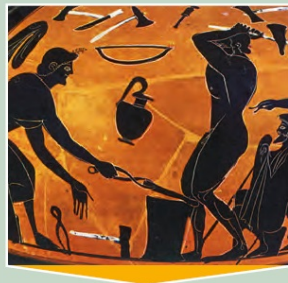
σιδηρουργός - σιδεράς

1. Να παρατηρήσεις τις παραστάσεις των αγγείων και να γράψεις ποια είναι τα επαγγέλματα των ανθρώπων που φαίνονται σ' αυτές.