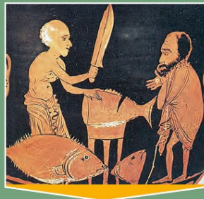
ψαράς - ιχθυοπώλης