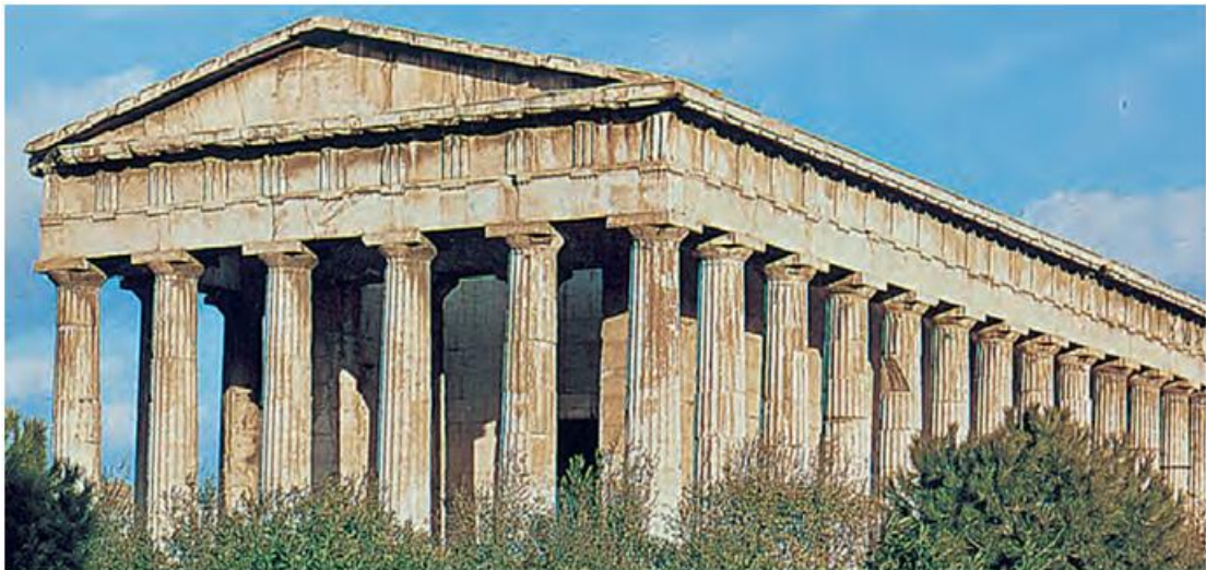
2. Ο ναός του Ηφαίστου, το γνωστό Θησείο. Εδώ κατέφευγαν πολλές φορές οι δούλοι ζητώντας τον θεό.