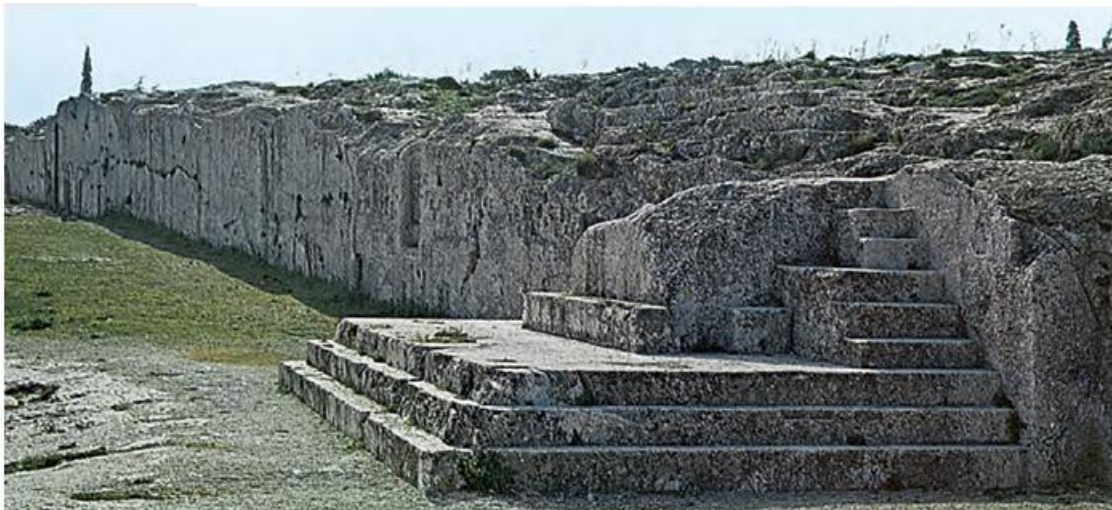
1. Ο λόφος της Πνύκας ήταν ο χώρος όπου συνεδρίαζε η Εκκλησία του δήμου. Στην εικόνα φαίνεται το σημείο όπου στέκονταν όσοι μιλούσαν.

ο πολίτης: ο υπήκοος κάποιου κράτους που έχει όλα τα πολιτικά δικαιώματα.