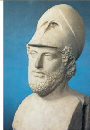
3. Ο Περικλής (Λονδίνο, Βρετανικό Μουσείο)

Θουκυδίδης, Ιστορία, Β', 65, 8-10 (διασκευή)