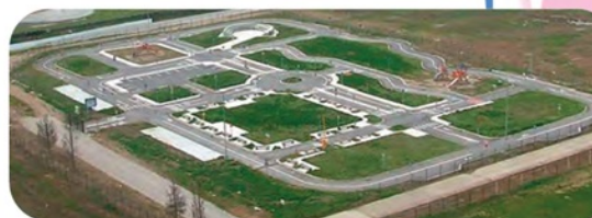
Πάρκο Κυκλοφοριακής Αγωγής Σερρών, www.e-view.gr/.../parko_kuklof_agogis.jpg

Πάρκο Κυκλοφοριακής Αγωγής ΥΜΕ, Αριστοτέλειο Πανεπιστήμιο Θεσσαλονίκης, Τμήμα Αγρονόμων και Τοπογράφων Μηχανικών, Ιούλιος 2002 (διασκευή)