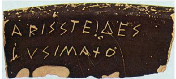
3. Οστρακο με το όνομα του Αριστείδη. (Αθήνα, Μουσείο Αρχαίας Αγοράς)

Ο λαός στο δημοκρατικό πολίτευμα σήμερα μπορεί να εκφράσει με την ψήφο του τη θέλησή του και την απόφασή του για πολύ σοβαρά ζητήματα, όπως παλιά στην αρχαία Αθήνα με το μέτρο του οστρακισμού.