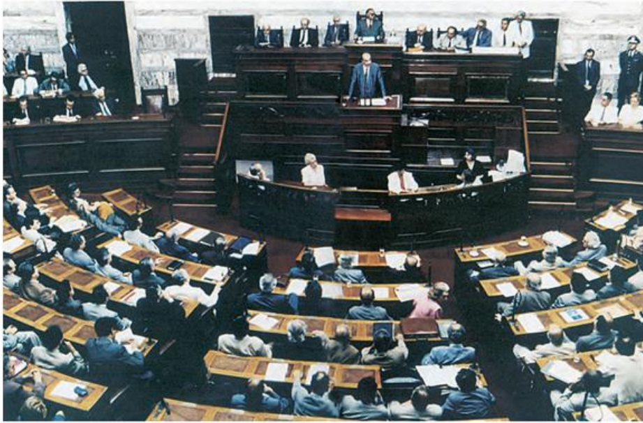
2. Το κοινοβούλιο σήμερα

Η Αθήνα στο μεταξύ είχε μεγαλώσει. Στην πόλη είχαν εγκατασταθεί και πολλοί ξένοι που ασχολούνταν με το εμπόριο. Οι άνθρωποι αυτοί δεν είχαν διαφορές μεταξύ τους ούτε είχαν πάρει μέρος στις συγκρούσεις που είχαν γίνει πιο παλιά. Για πολλά χρόνια επικράτησε στην πόλη ηρεμία. Οι Αθηναίοι όφειλαν πολλά στον Κλεισθένη, θεμελιωτή της δημοκρατίας.