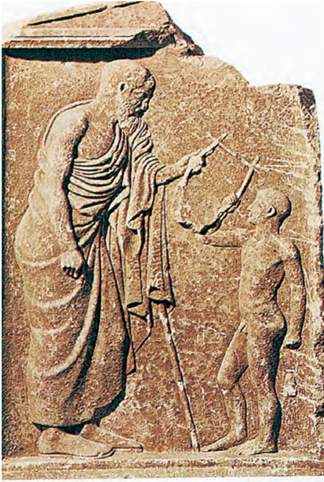
2. Ο ολυρικός ποιητής Πίνδαρος μαζί με έναν μικρό μαθητή του (Βασιλεία, Ιστορικό Μουσείο)

Ο αγώνας που έκαναν οι άνθρωποι για να τα βγάλουν πέρα με τις καθημερινές ανάγκες τους οδήγησε σε πολλές σκέψεις. Κάποιοι άρχισαν να ασχολούνται με θέματα που δεν μπορούσαν οι ίδιοι να εξηγήσουν. Προσπαθούσαν