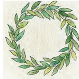
1. Τους αθλητές στεφάνωναν με στεφάνι αγριελιάς.

Οι αρχαίοι Έλληνες τιμούσαν ιδιαίτερα τους νικητές. Οι Ολυμπιονίκες, όταν γύριζαν στην πατρίδα τους, έμπαιναν στην πόλη όχι από την κύρια πύλη, αλλά από ένα άνοιγμα που γινόταν στο τείχος. Μ' αυτόν τον τρόπο οι πολίτες πίστευαν ότι σε περίπτωση κινδύνου το κενό θα το κάλυπτε με το στήθος του ο αθλητής.