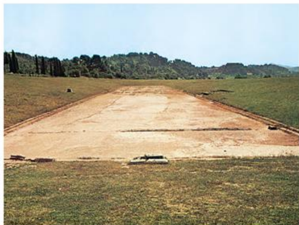
4. Το στάδιο της αοχαίας Ολυμπίας