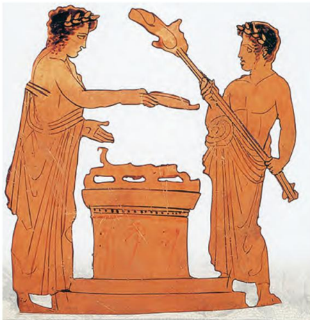
3. Στον ιερό βωμό του μαντείου των Δελφών ήταν πάντα αναμμένη η φωτιά.

Οι Έλληνες, όπως πολλοί άνθρωποι, ήθελαν να προβλέπουν το μέλλον. Για να βρουν απαντήσεις στα προβλήματά τους πήγαιναν στα μαντεία. Το πιο γνωστό ήταν το μαντείο των Δελφών, το οποίο ήταν αφιερωμένο στον θεό Απόλλωνα. Οι χρησμοί, όπως λέγονταν οι απαντήσεις που έδινε η Πυθία, δεν είχαν πάντοτε ξεκάθαρο νόημα.