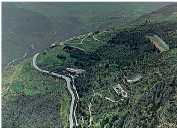
5. Ο αρχαιολογικός χώρος των Δελφών