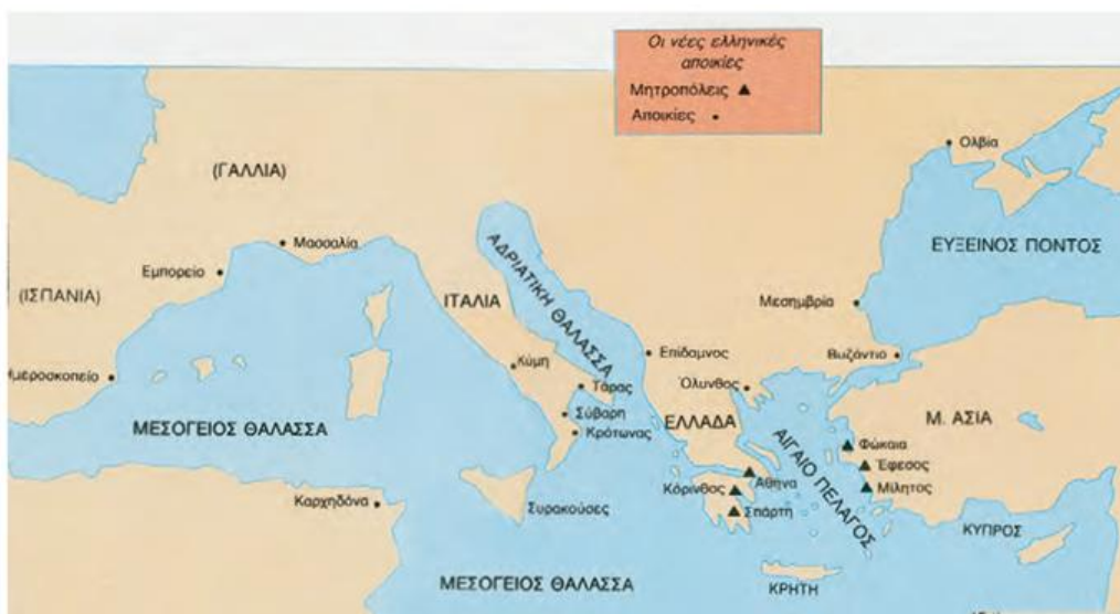
1. Χάρτης των αποικιών

Οι Έλληνες εγκατέλειψαν τα χωριά και συγκεντρώθηκαν στις πόλεις. Η πόλη έγινε κράτος με ακρόπολη και τείχος. Τότε ιδρύθηκαν πολλές αποικίες στα παράλια της Μεσογείου και του Εύξεινου Πόντου, όπου γνώρισε μεγάλη ανάπτυξη ο ποντιακός ελληνισμός.