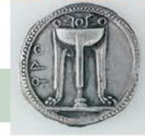
Ασημένιο νόμισμα από τον Κρότωνα, αποικία στη Μεγάλη Ελλάδα (Εθνικό Νομισματικό Μουσείο).