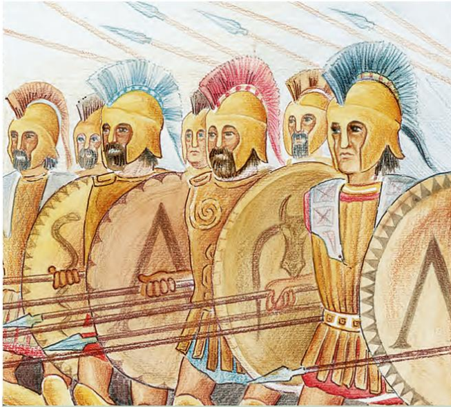
1. Σπαρτιατική φάλαγγα

Με τον ίδιο τρόπο μορφώνονταν και τα κορίτσια, τα οποία, όπως και τα αγόρια, ασκούσαν στα γυμναστήρια. Φορούσαν κοντά φορέματα και έπαιρναν μέρος σ' όλες τις γιορτές και τις εκδηλώσεις. Με αυτό τον τρόπο θα έπλαθαν γερό σώμα και θα γίνονταν αργότερα άξιες μητέρες.