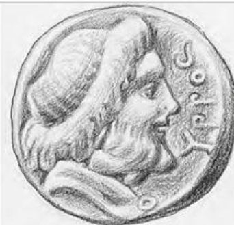
3. Αναπαράσταση από σπαρτιατικό νόμισμα. Το πρόσωπο που απεικονίζεται είναι ο Λυκούργος. (Αθήνα, Εθνικό Αρχαιολογικό Μουσείο)