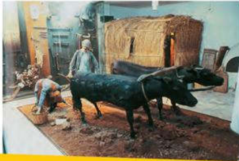
Όργωμα χωραφιού, Αρχές του 20ού αιώνα

Μπορείς να βοηθήσεις τη Χαρά να περιγράψει σε μια συμμαθήτριά της, που δεν επισκέφτηκε το λαογραφικό μουσείο, αυτό που βλέπεις στην εικόνα;