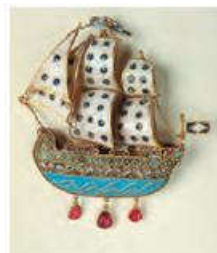
Σκουλαρίκι καράβι Δωδεκάνησα-Πάτμος 18ος αιώνας

Παρατήρησε τις εικόνες, διάβασε τις φράσεις και πες.