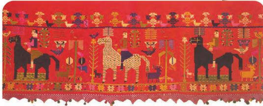
Μιπατανία (κεντητό σκέπασμα κρεβατιού) από την Κρήτη

Την ιστορία αυτή την έγραψε η Ευγενία Φακίνου παρατηρώντας λαϊκά κεντήματα. Γράψε και συ τη δική σου ιστορία παρατηρώντας το παρακάτω κέντημα.