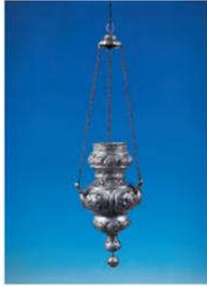
Ασημένιο καντήλι από την Κωνσταντινούπολη 18ος αιώνας

Αυτό είναι ένα καντήλι ασημένιο από την Κωνσταντινούπολη. Φτιάχτηκε στα τέλη του 18 ου αιώνα.