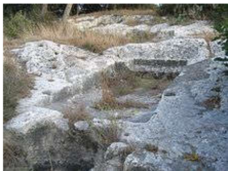
Πατητήρι στην αρχαία εποχή-Ισραήλ

Πηγές αναφέρουν ότι από την 4η χιλιετία π.Χ στον ελληνικό χώρο ήταν γνωστή η καλλιέργεια της αμπέλου [3] . Την καλλιεργούσαν για τροφή , παραγωγή κρασιού και αργότερα της σταφίδας . Τα αρχαία πατητήρια ( ληνοί ) λειτουργούσαν παρόμοια με τα σημερινά. Ήταν πρότυπες κατασκευές σε επικλινές έδαφος ώστε ο χυμός να κυλά και να συλλέγεται στο χαμηλότερο κτίσμα (υπολήνιο). Κατά την πανηγυρική αυτή διαδικασία, οι πατητές κάνοντας ρυθμικές κινήσεις τραγουδούσαν τους Επιλήνιους ύμνους [4] . Κατόπιν συνέλεγαν τον χυμό σε μεγάλα πιθάρια τα οποία τα σφράγιζαν και τα έθαβαν για να επέλθει η ζύμωση .