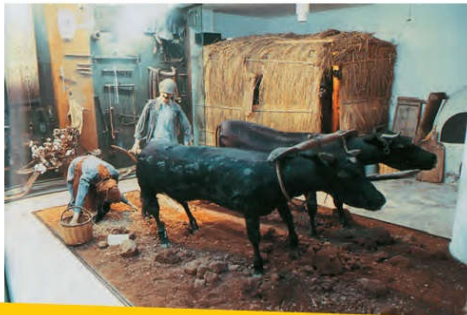
Όργωμα χωραφιού, Αρχές του 20ού αιώνα

Μπορείς να βοηθήσεις τη Χαρά να περιγράψει σε μια συμμαθήτριά της, που δεν επισκέφτηκε το λαογραφικό μουσείο, αυτό που βλέπεις στην εικόνα;