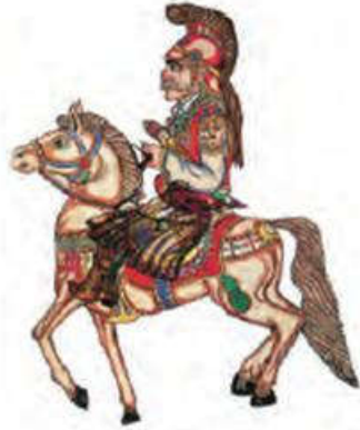
Φιγούρα Καραγκιόζη του Σπ. Κούζαρου Αθήνα 1979

Αυτό είναι μια φιγούρα του Καραγκιόζη ή, όπως το λέμε, του θεάτρου σκιών. Η φιγούρα ονομάζεται «Ο Κολοκοτρώνης έφιππος», δηλαδή πάνω σε άλογο. Την ζωγράφισε ο καραγκιοζοπαίχτης Σπύρος Κούζαρος το 1979 στην Αθήνα.