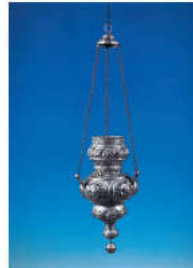
Ασημένιο καντήλι από την Κωνσταντινούπολη 18ος αιώνας