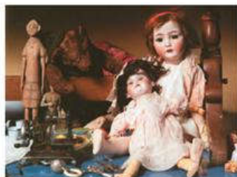
Παλιά παιχνίδια από τη συλλογή του παιδικού μουσείου «Σταθμός»