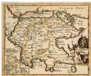
Χάρτης Πελοποννήσου Χαλκογραφία 1686