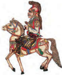
Φιγούρα Καραγκιόζη του Σπ. Κούζαρου Αθήνα 1979

Διάβασε τι γράφουν οι καρτέλες και τι είπε η δασκάλα και σύγκρινέ τα. Οι καρτέλες ή τα λόγια της δασκάλας έχουν λιγότερες λέξεις;