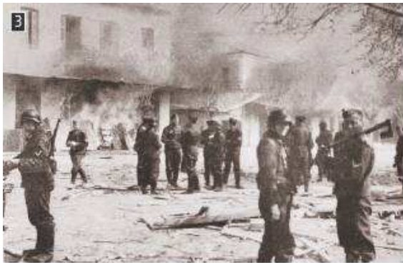
▲ Γερμανοί στρατιώτες στο κατεστραμμένο Δίστομο

Οι πράξεις αντίστασης προκάλεσαν όμως τα αντίποινα των κατακτητών. Η τρομοκρατία, το κάψιμο ολόκληρων χωριών όπως τα Καλάβρυτα, το Δίστομο, το Μεσόβουνο, οι Πύργοι και η Κάνδανος καθώς και οι μαζικές εκτελέσεις υπήρξαν το βαρύ τίμημα της ελευθερίας. Στα τέλη του 1944 η τετραετής σχεδόν Κατοχή έφτασε στο τέλος της. Οι Γερμανοί και οι σύμμαχοι τους, νικημένοι στα πεδία των μαχών, αποσύρθηκαν από την Ελλάδα. Τον Οκτώβριο του 1944 η ελληνική Κυβέρνηση, που είχε καταφύγει στη Μέση Ανατολή, επέστρεψε στην Αθήνα. Ήταν η στιγμή της Απελευθέρωσης.