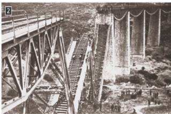
▲ Η γέφυρα του Γοργοποτάμου που ανατινάχθηκε από τις αντιστασιακές δυνάμεις, φωτ. Αρχείο ΔΟΛ.

Σχόλιο [j5]: ανεφοδιάζω -ομαι P2.1 : ανανεώνω την παροχή εφοδίων: ~ το στράτευμα / την αγορά. Το αεροπλάνο ανεφοδιάστηκε με καύσιμα και συνέχισε την πτήση του για Νέα Υόρκη.