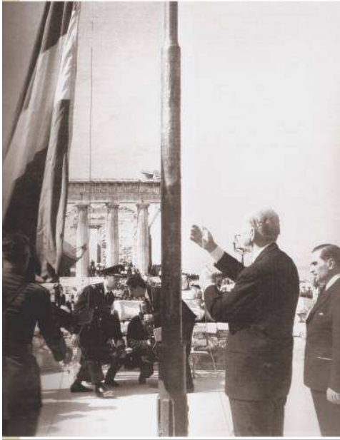
◀ Οκτώβριος 1944. Η στιγμή της Απελευθέρωσης. Ο ηρω- θύπουργος Γεώργιος Παπανδρέου υψώνει την εθνι- κή σημαία στον ιερό βρόχο της Ακρόπολης, Αθήνα