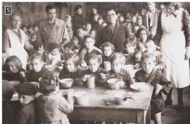
Συσσίτιο για τα πεινασμένα παιδιά της Αθήνας το 1943, Αθήνα

Σχόλιο [j2]: μαστίζω -ομαι P2.1 : για κτ. βλαβερό ή κακό που υπάρχει ή συμβαίνει σε μεγάλο βαθμό, με συνέπεια να προκαλεί μεγάλες ταλαιπωρίες: Πείνα κι επιδημίες μαστίζαν τη χώρα. Μεγάλα τμήματα του λαού μαστίζονται ακόμα από τον αναλφabetισμό.