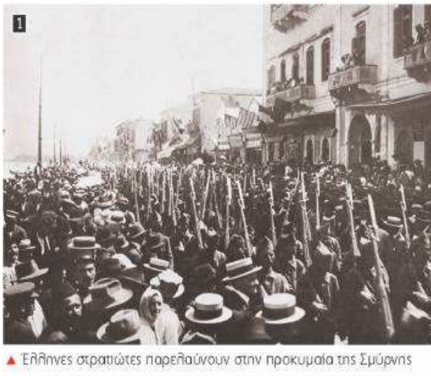
▲ Έλληνες στρατιώτες παρελαύνουν στην προκυμαία της Σμύρνης