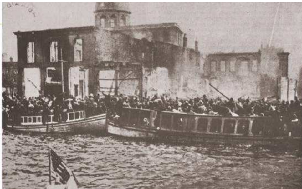
▲ Η Σμύρνη καίγεται, οι χριστιανοί κάτοικοί της προσπαθούν απεγνωσμένα να σωθούν, ενώ οι ναύτες των συμμασικών δυνάμεων παρακολουθούν αμέτοχοι

Σχόλιο [j2]: εστία η O25 : ο τόπος μόνιμης κατοικίας ή γενικά η πατρίδα κάποιου: Επάνοδος των προσφύγων / των αιγμαλιότων στις εστίες τους. (έκφρ.) υπέρ βομών* και εστίων. || (ειδικότ.): Οικογενειακή / συζυγική / πατρική ~.