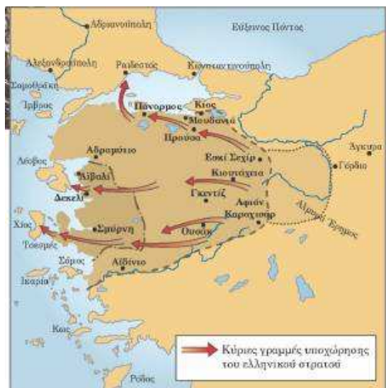
Η πορεία του ελληνικού στρατού