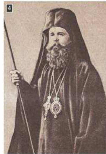
▲ Ο Μητροπολίτης Τραπεζούντας Χρυσανθος Φιλιππίδης

Η εκλογική ήττα του Βενιζέλου – η επιστροφή του βασιλιά Κωνσταντίνου – η συνέχιση του πολέμου – η αλλαγή της ηγεσίας του στρατεύματος