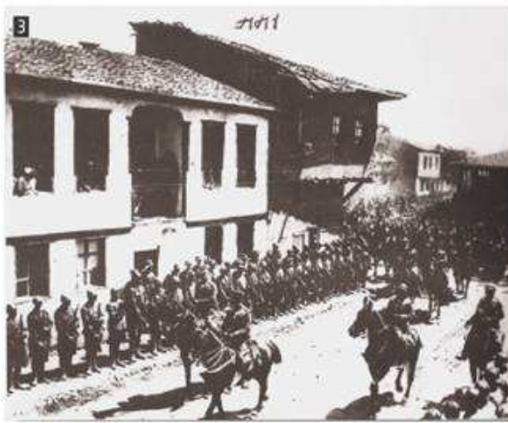
▲ Ελληνες στρατιώτες εισέρχονται στην πόλη Ουσάκ της Μικράς Ασίας