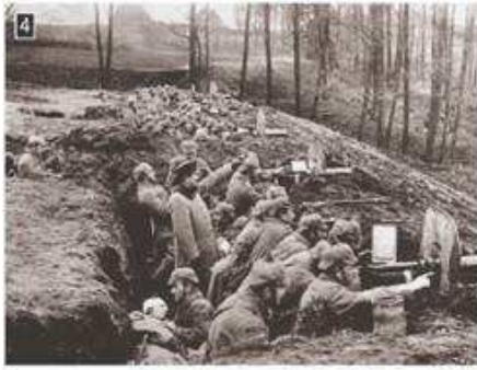
▲ Ο πόλεμος των χαρακωμάτων υπήρξε το χαρακτηριστικό γνώρισμα των συγκρούσεων κατά τον Α΄ Παγκόσμιο Πόλεμο