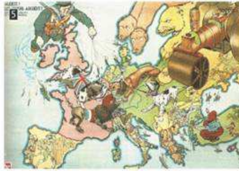
▲ Γεωγραφία που απεικονίζει τις συγκρούσεις και τις αντιπαράθεσεις των ευρωπαϊκών χωρών την περίοδο του Α΄ Παγκοσμίου Πολέμου