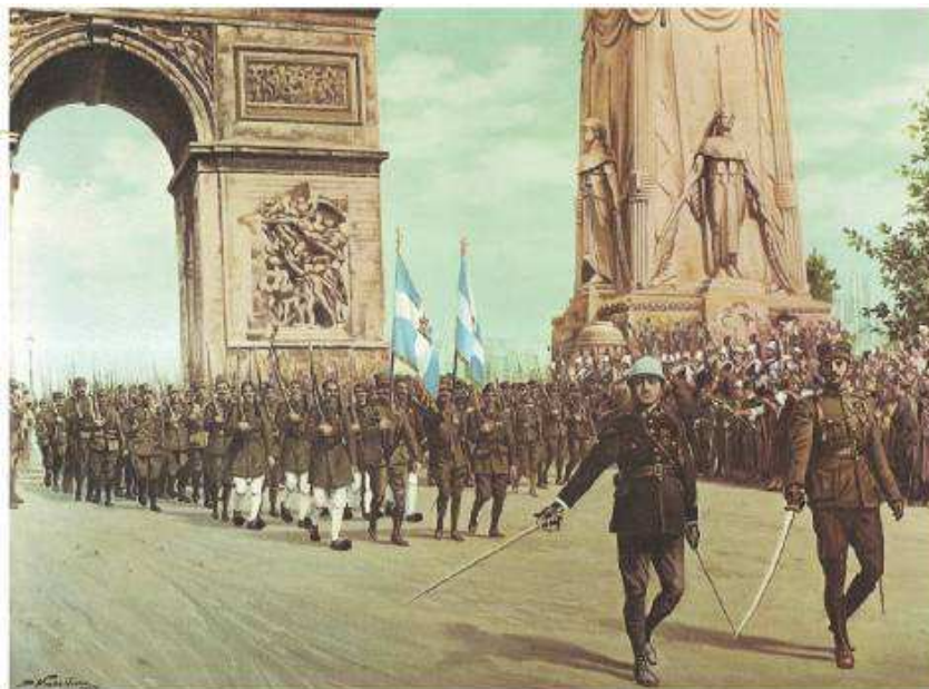
▲ Ελληνικό στρατιωτικό σώμα παρελαύνει κάτω από την Αψίδα του Θριάμβου στο Παρίσι στις 14 Ιουλίου 1919, Αθήνα, Εθνικό Ιστορικό Μουσείο.

Σχόλιο [j1]: διχασμός ο Q17 : η ενέργεια ή το αποτέλεσμα του διχάζω, διάσπαση μιας ενότητας. α. η πρόκληση διχόνοιας και η κατάσταση που δημιουργείται από αυτή, σε ένα οργανωμένο σύνολο ατόμων: Ο εθνικός ~ οδήγησε στη Μικρασιατική Καταστροφή.