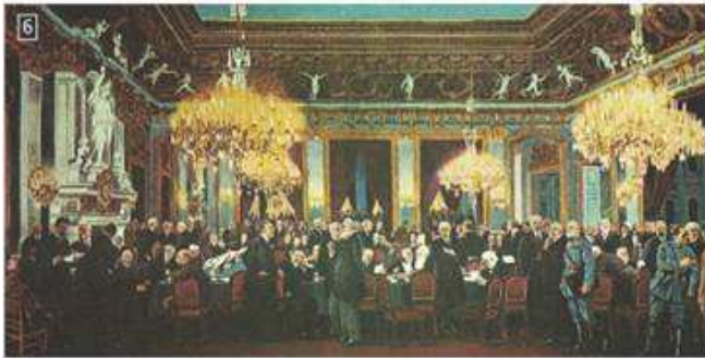
▲ Το Συνέδριο της Ειρήνης, που πραγματοποιήθηκε στο Παρίσι το 1919, τερμάτισε τον Α΄ Παγκόσμιο Πόλεμο