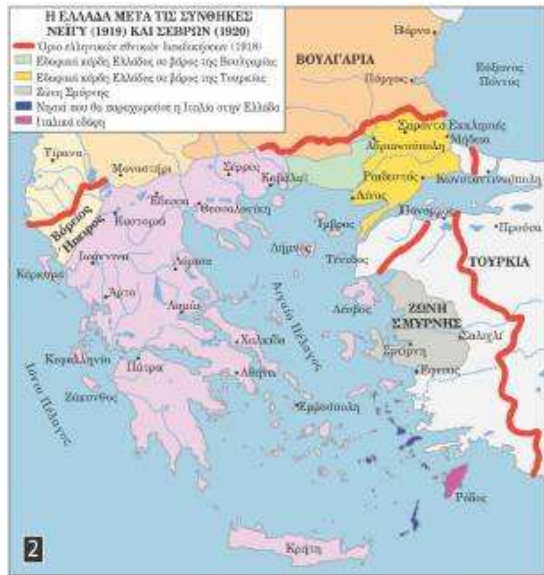
▲ Η Ελλάδα μετά τις συνθήκες Νεϊγύ και Σεβρών

Συνθήκη των Σεβρών (10 Αυγούστου 1920) κατοχύρωσε τα νησιά του Αιγαίου, με εξαίρεση τα Δωδεκάνησα, κέρδισε τη Δυτική και την Ανατολική Θράκη (εκτός από την Κωνσταντινούπολη) και ανέλαβε για πέντε χρόνια τη διοίκηση στην περιοχή της Σμύρνης.