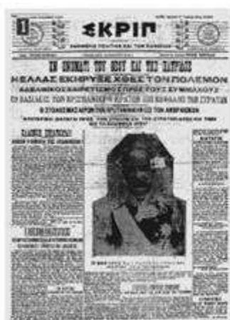
Η κήρυξη του Α΄ Βαλκανικού Πολέμου, όπως αποτυπώθηκε στο πρωτοσέλιδο της ελληνικής εφημερίδας Εκρηκ

μάχη στα Γιαννιτσά (19-20 Οκτωβρίου 1912), η οποία έληξε με νίκη των Ελλήνων. Αργά το βράδυ της 26ης Οκτωβρίου 1912 ο Οθωμανός διοικητής της πόλης Χασάν Ταχσίν Πασάς υπέγραψε το Πρωτόκολλο παράδοσης της Θεσσαλονίκης στους Έλληνες. Δύο μέρες αργότερα ο διάδοχος Κωνσταντίνος και τμήματα του ελληνικού στρατού μπήκαν στην πόλη και έγιναν δεκτοί με ενθουσιασμό.