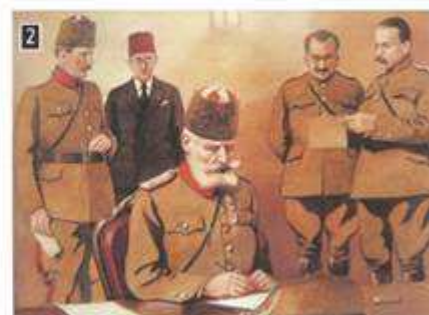
Ο Χασάν Ταχσίν Πασάς υπογράφει την παράδοση της Θεσσαλονίκης, υδατογραφία, συλλογή Δημοτικής Πινακοθήκης Θεσσαλονίκης