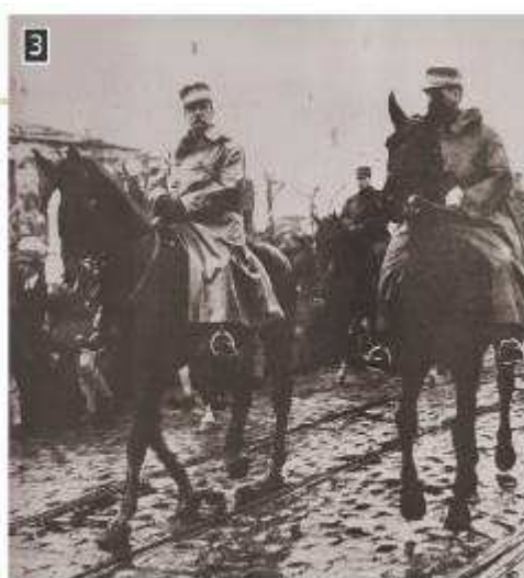
Η είσοδος του βασιλιά Γεώργιου Α΄ και του διαδόχου Κωνσταντίνου στη Θεσσαλονίκη, Αθήνα, Γεννάδειος Βιβλιοθήκη