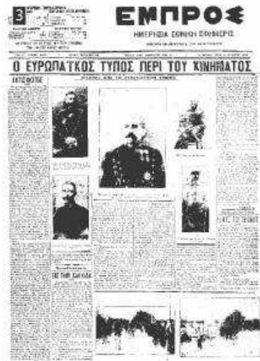
▲ Πρωτοσέλιδο της εφημερίδας Εμπρός για το κίνημα στο Γουδί