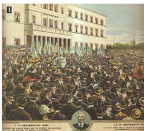
▲ Ο Βασιλιάς Γεώργιος μιλά στους εξεγερμένους Αθηναίους, Αθήνα, Εθνικό Ιστορικό Μουσείο

Σχόλιο [j1]: οπλίτης ο O10 : (στρατ.) 1. χαρακτηρισμός του στρατιωτικού που δεν είναι βαθμοφόρος: Αξιωματικοί, υπαξιωματικοί και οπλίτες. Θάλαμος οπλιτών. || (επέκτ.) για τους στρατιώτες και τους υπαξιωματικούς σε αντιδιαστολή με τους αξιωματικούς: Στην προνή αναφορά της επιλαρχίας ήταν παρόντες: αξιωματικοί 35, οπλίτες 353.