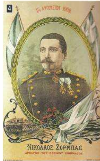
▲ Ο συνταγματάρχης Νικόλαος Ζορμπάς ήταν ένας από τους επικεφαλής του κινήματος στο Γουδί