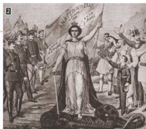
▲ Λαϊκή εικόνα που εξυμνεί το επαναστατικό κίνημα στο Γουδί, Αθήνα, Εθνικό Ιστορικό Μουσείο