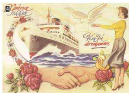
▲ Ευχές για καλή ανάσταση από τους Έλληνες μετανάστες στην Αυστραλία