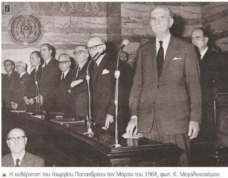
▲ Η κυβέρνηση του Γεωργίου Παπανδρέου τον Μάρτιο του 1964, φωτ. Κ. Μεγαλοκονόμου