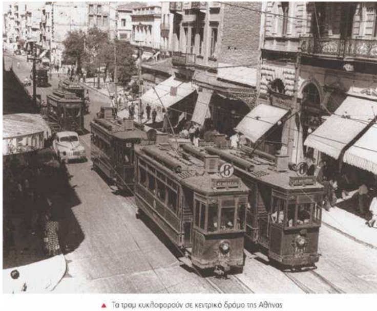
▲ Τα τραμ κυκλοφορούν σε κεντρικό δρόμο της Αθήνας

Μετά το τέλος του Εμφυλίου Πολέμου η Ελλάδα είχε να αντιμετωπίσει πολλά προβλήματα. Ωστόσο, σταδιακά άρχισε και πάλι να προοδεύει.