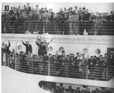
▲ Έλληνες μετανάστες φτάνουν στην Αυστραλία (1956)

Ο Εμφύλιος, η φτώχεια και οι δύσκολες συνθήκες ζωής στην ύπαιθρο οδήγησαν μεγάλο τμήμα του αγροτικού πληθυσμού να εγκατασταθεί στις πόλεις, αναζητώντας δουλειά. Εκεί οικοδομήθηκαν πλήθος πολυκατοικιών. Δόθηκε επίσης έμφαση στην ανάπτυξη της βιομηχανίας αλλά και των τουριστικών επιχειρήσεων, ενός νέου κλάδου απασχόλησης. Πολλοί Έλληνες μετανάστευσαν στην Αυστραλία αλλά και σε χώρες της Ευρώπης, της Αμερικής και της Αφρικής, επιζητώντας μια καλύτερη ζωή.