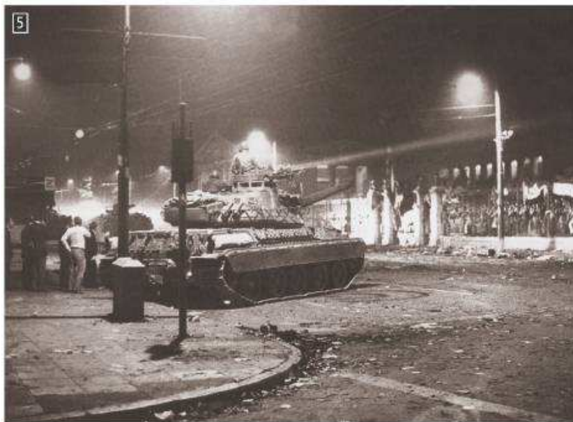
▲ 17 Νοεμβρίου 1973. Άρμα μάχης ετοιμάζεται να παραβιάσει την πύλη του Ποθιτεχνείου, φωτ. Β. Καραμανώλης.