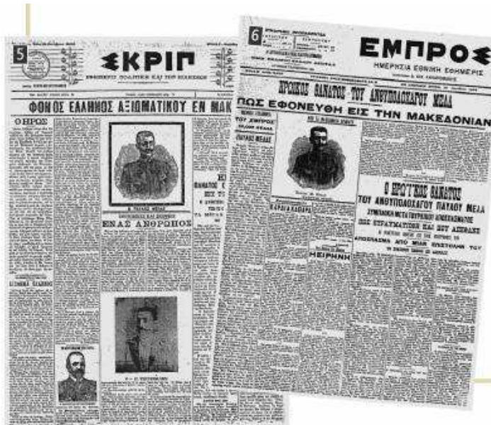
▲ Ελληνικές εφημερίδες της εποχής αναγγέλλουν τον θάνατο του Παύλου Μελά

Ο θάνατος του νεαρού αξιωματικού Παύλου Μελά σε σύγκρουση με τον τουρκικό στρατό στο χωριό Στάτισσα (σημερινό Μελάς) της Καστοριάς, στις 13 Οκτωβρίου 1904, κινητοποίησε τους Έλληνες και έκανε την ελληνική Κυβέρνηση να διεκδικήσει δυναμικότερα τη Μακεδονία, εγκαταλείποντας τους δισταγμούς της.