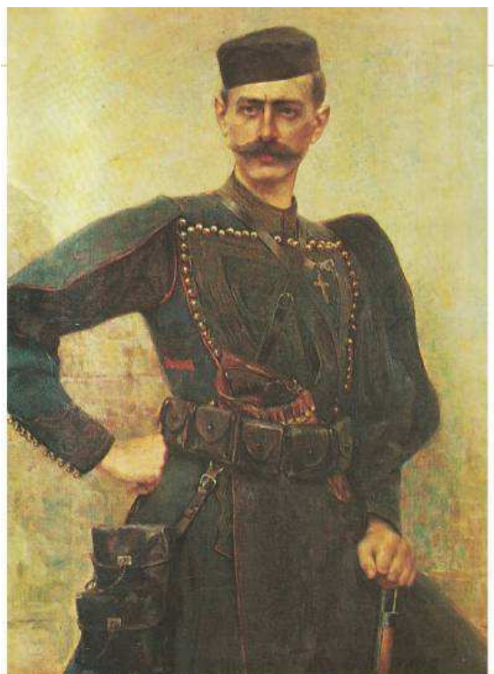
▲ Ο Παύλος Μελάς σε πίνακα του Ιακωβίδη, Αθήνα, Εθνικό Ιστορικό Μουσείο

Μετά την ήττα στον πόλεμο με την Τουρκία, το 1897, το ελληνικό κράτος απασχόλησαν τα ζητήματα της Κρήτης και της Μακεδονίας. Μακεδονικός Αγώνας ονομάζεται η ένοπλη σύγκρουση Ελλήνων και Βουλγάρων ανταρτών στο χώρο της Μακεδονίας την περίοδο 1904-1908.