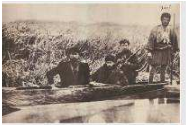
Ο Τέλλος Αγαπηνός (καπετάν Άγρας) με άνδρες του στη λίμνη των Γιαννιτσών, Αθήνα, συλλογή Ιωάννη Μαζαράκη

Ο καπετάν Κώτας από τη Ρούπια (σημ. Κώτας) της Φλώρινας, εμβληματική μορφή της εθνικής άμυνας στη Μακεδονία