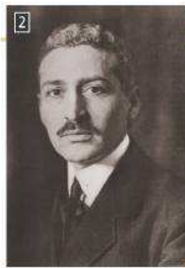
▲ Ο Ίων Δραγούμης, Υποπρόξενος στο Μοναστήρι