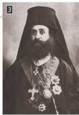
▲ Ο Μητροπολίτης Καστοριάς Γερμανός Καραβαγγέλης