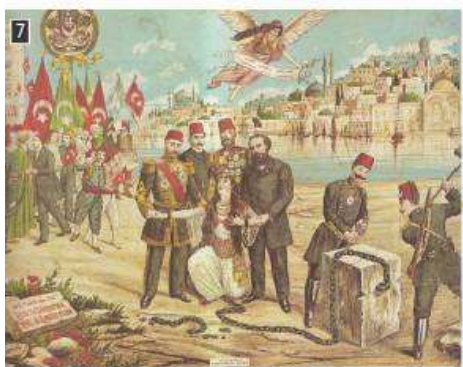
▲ Λαϊκή εικόνα της επανάστασης των Νεοτούρκων, Αθήνα, Εθνικό Ιστορικό Μουσείο

Για τα επόμενα τέσσερα χρόνια η ελληνική απερίθωτη στη Μακεδονία ανέκοψε τη βουλγαρική διείσδυση. Η ένοπλη φάση του Μακεδονικού Αγώνα διακόπηκε το 1908. Τη χρονιά αυτή πολλοί φιλελεύθεροι Τούρκοι, που ονομάστηκαν Νεότουρκοι, επαναστάτησαν αντιδρώντας στην απολυταρχική διοίκηση του Σουλτάνου και στις συνεχείς επεμβάσεις των Μεγάλων Δυνάμεων στην Οθωμανική Αυτοκρατορία. Πεισμένοι από τις διακηρύξεις των Νεοτούρκων για παραχώρηση δικαιωμάτων, Έλληνες και Βούλγαροι αντάρτες κατέθεσαν τα όπλα. Ο αγώνας για τη διεκδίκηση της Μακεδονίας θα συνεχιζόταν κατά τους Βαλκανικούς Πολέμους.