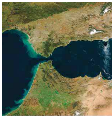
Εικόνα 8.3: Πορθμός