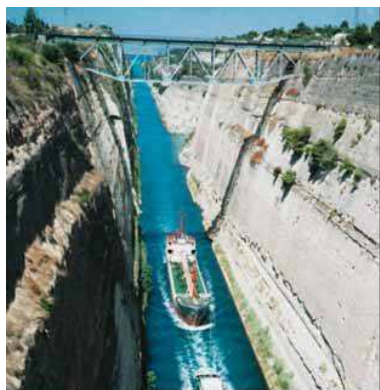
Εικόνα 8.2: Διώρυγα