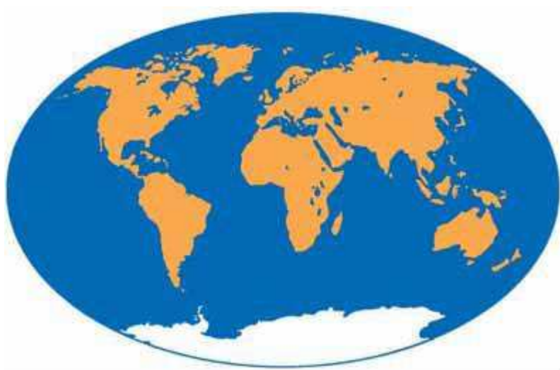
Εικόνα 8.1: Η Γη