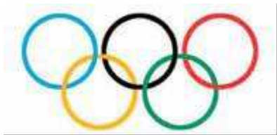
Εικόνα 7.2: Το ολυμπιακό έμβλημα

Ποιες ηπείρους θα διασχίσετε; β) Υπάρχουν ήπειροι που δε συναντήσατε; γ) Ποιον παράλληλο κύκλο θα ακολουθήσετε, ώστε να μη συναντήσετε καθόλου στεριά;