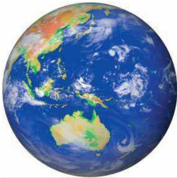
Εικόνα 7.1: Ο «γαλάζιος πλανήτης»

Η θάλασσα καλύπτει τα 7/10 της γήινης επιφάνειας, ενώ το υπόλοιπο είναι η ξηρά. Η θάλασσα χωρίζει την ξηρά σε πολύ μεγάλες εκτάσεις, τις οποίες ονομάζουμε ηπείρους. Αυτές κατά σειρά μεγέθους είναι οι εξής: Ασία, Αμερική (Βόρεια και Νότια), Αφρική, Ευρώπη, Ωκεανία. Η Ανταρκτική, που δεν κατοικείται, είναι μια τεράστια παγωμένη έκταση και θεωρείται από πολλούς ως έκτη ήπειρος.