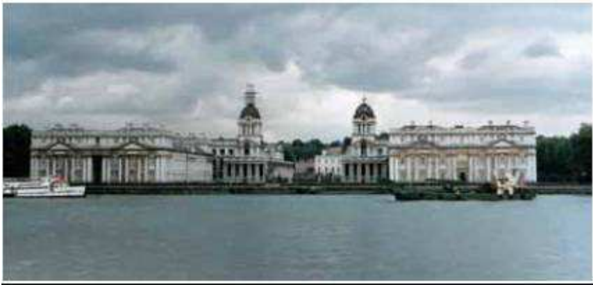
Εικόνα 2.4: Γκρίνουιτς, Λονδίνο