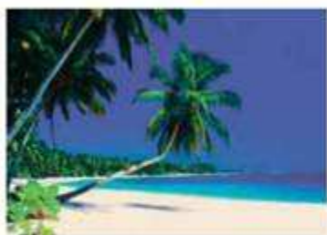
Εικόνα 2.3α: Ινδονησία