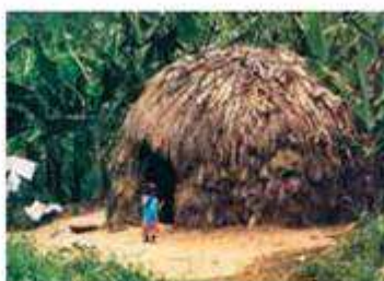
Εικόνα 2.3δ: Κένυα