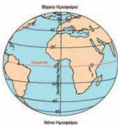
Εικόνα 2.2: Βόρειο και νότιο ημισφαίριο της Γης

Στην υδρόγειο σφαίρα διακρίνονται επίσης οριζόντιες κυκλικές γραμμές, οι παράλληλοι κύκλοι. Ο μεγαλύτερος παράλληλος κύκλος είναι ο Ισημερινός, μία φανταστική γραμμή που χωρίζει τη Γη σε δύο ίσα μέρη, στο βόρειο και το νότιο ημισφαίριο.