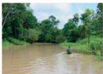
Εικόνα 2.3γ: Αμαζόνιος