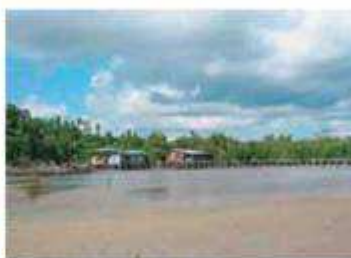
Εικόνα 2.3β: Βόρνεο