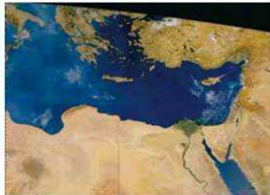
Εικόνα 14.2: Ο Νείλος ποταμός

Η εικόνα 14.1 παρουσιάζει τον Αμαζόνιο, τον δεύτερο μεγαλύτερο σε μήκος ποταμό της Γης μετά τον Νείλο (εικόνα 14.2). Γύρω από τις όχθες του Αμαζονίου βρίσκεται το μεγαλύτερο δάσος της Γης. Εδώ παράγεται με τη διαδικασία της