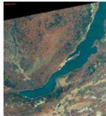
Εικόνα 14.4: Λίμνη Βαϊκάλη

Οι λίμνες της Γης καλύπτουν λιγότερο από το 2% της επιφάνειάς της. Οι περισσότερες περιέχουν γλυκό νερό. Μερικές είναι αλμυρές, όπως η Κασπία και η Νεκρή Θάλασσα, της οποίας μάλιστα το νερό είναι 7,7 φορές πιο αλμυρό από το θαλασσινό.