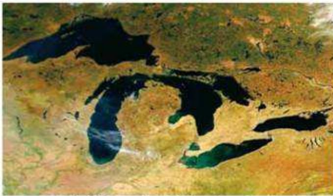
Εικόνα 14.3: Περιοχή μεγάλων λιμνών της Αμερικής