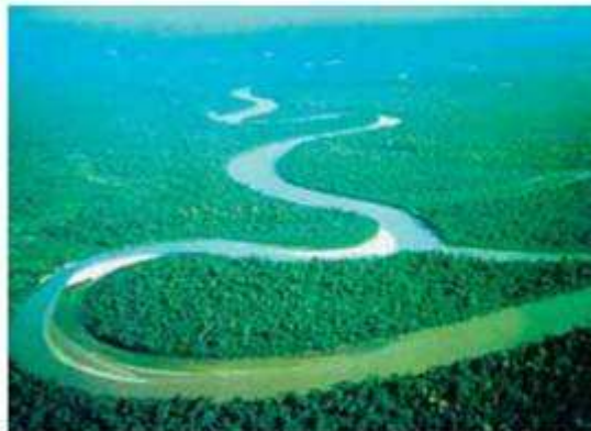
Εικόνα 14.1: Ο Αμαζόνιος ποταμός