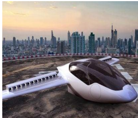
ΙΠΤΑΜΕΝΟ ΗΛΕΚΤΡΙΚΟ ΤΑΞΙ