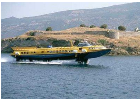
ΧΟΒΕΡ ΚΡΑΦΤ – ΙΠΤΑΜΕΝΟ ΔΕΛΦΙΝΙ