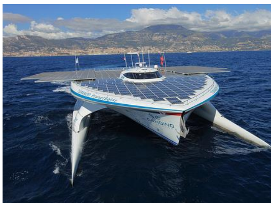
ΗΛΙΑΚΟ ΠΛΟΙΟ ΜΕ ΦΩΤΟΒΟΛΤΑΪΚΑ