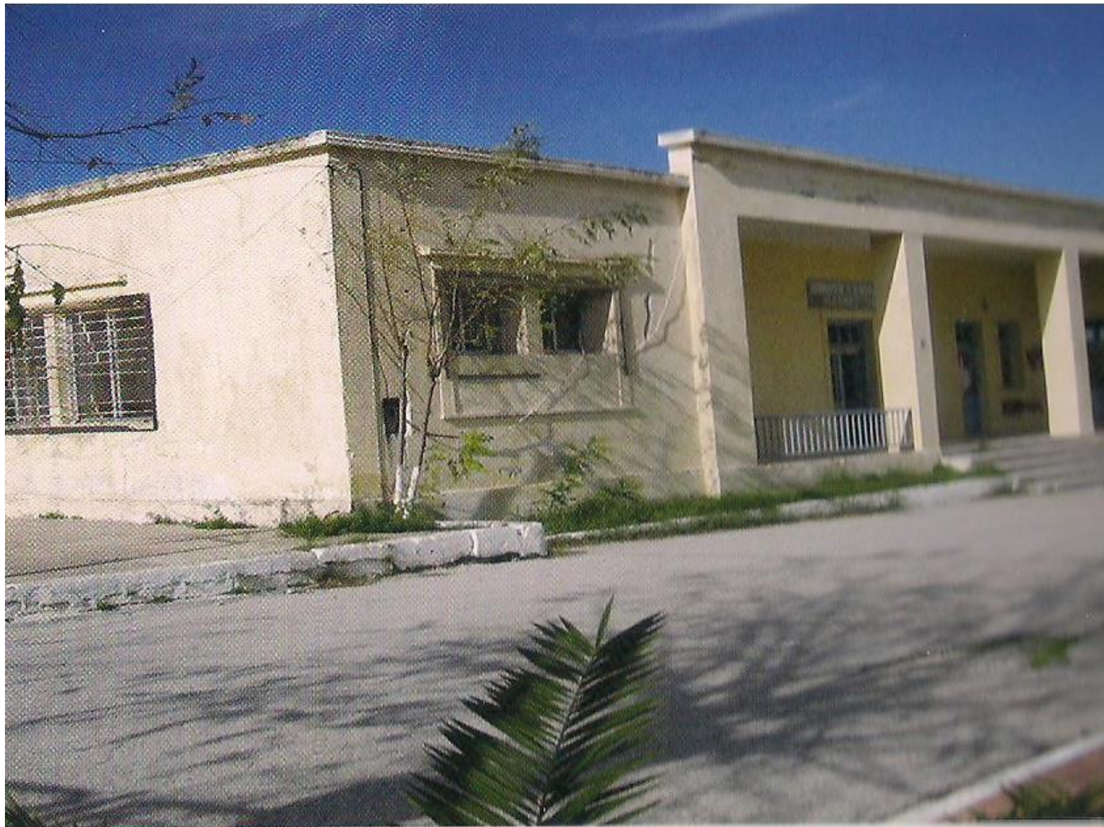
ΤΟ ΠΑΛΙΟ ΣΧΟΛΕΙΟ