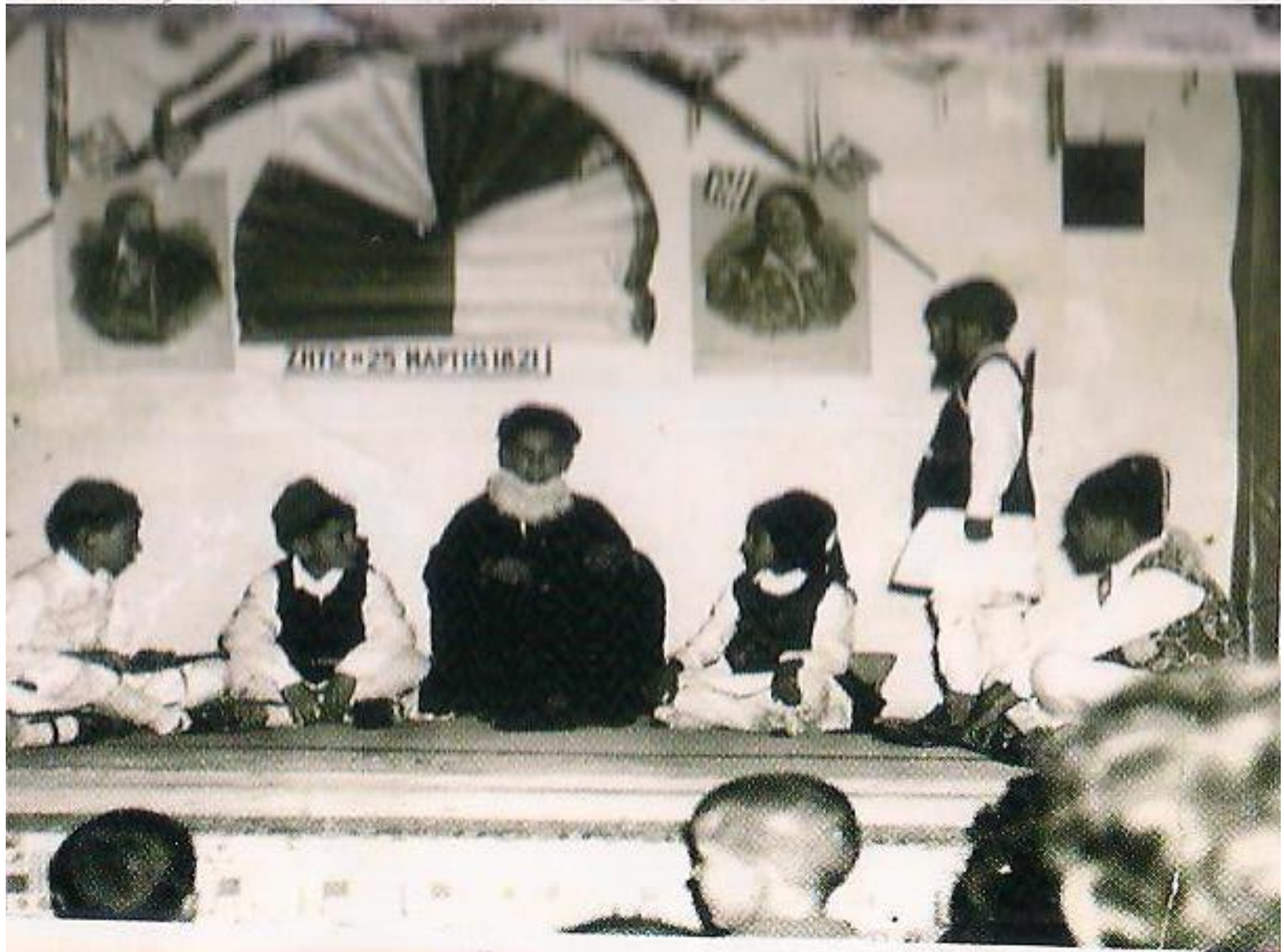
ΘΕΑΤΡΙΚΕΣ ΠΑΡΑΣΤΑΣΕΙΣ ΣΤΟ ΠΑΛΙΟ ΣΧΟΛΕΙΟ