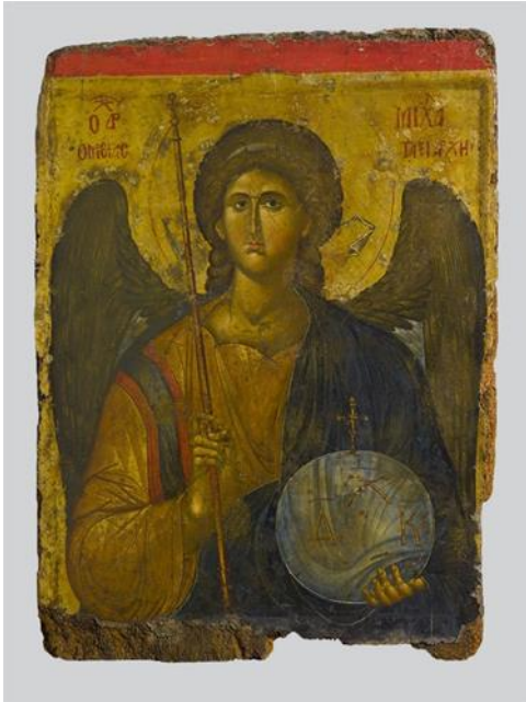
Αρχάγγελος Μιχαήλ, φορητή εικόνα 14 ος αι., Βυζαντινό και Χριστιανικό Μουσείο Αθηνών