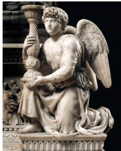
Μιχαήλ Άγγελος, Άγγελος με κηροπήγιο, Basilica San Domenico, Bologna, Italy