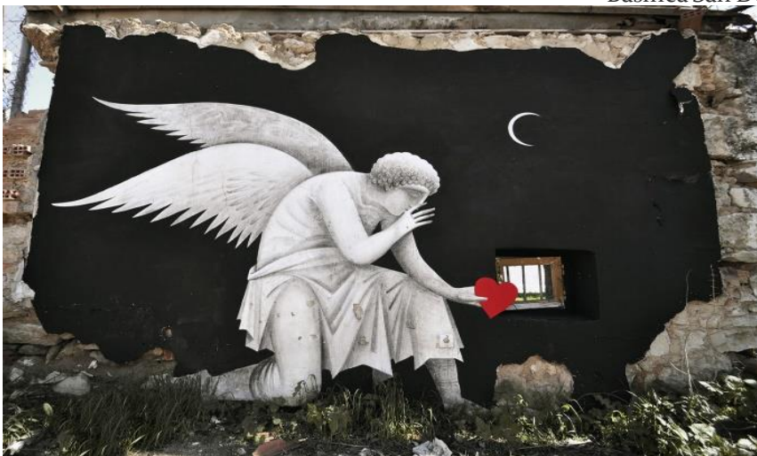
Φίκος, Wasted love, 2014 Γκράφτι Πειραιάς