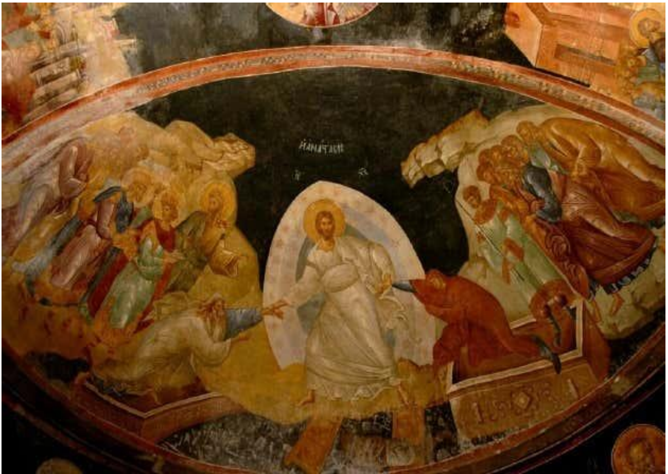
Εις Άδου Κάθοδος, τοιχογραφία Ι. Μ. Χώρας, Κωνσταντινούπολη, νεκρικό παρεκκλήσιο, 1315-1321