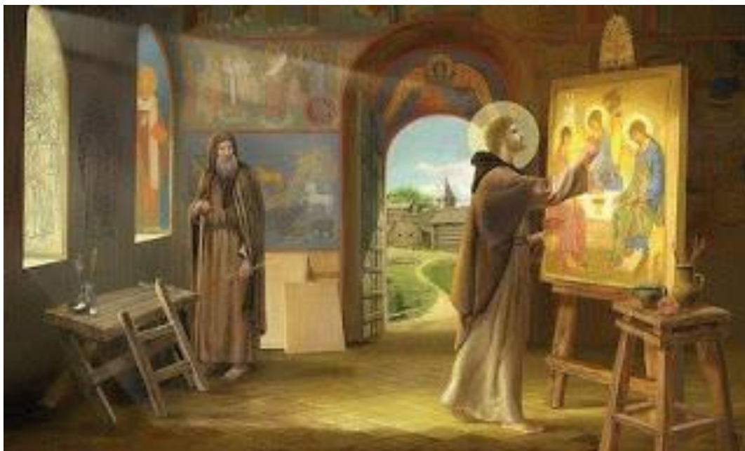
Ο Αντρέι Ρουμπλιόφ, περίφημος Ρώσος ζωγράφος και αγιογράφος (1360-1438), ιστορεί την εικόνα της Αγίας Τριάδας. [Σύγχρονος πίνακας].

Σήμερα θα προσπαθήσουμε να ανακαλύψουμε ορισμένες μορφές έκφρασης της χριστιανικής πίστης στην τέχνη και στη συνέχεια να αξιολογήσουμε την ποικιλία των τρόπων έκφρασης του θρησκευτικού συναισθήματος στην Ορθόδοξη παράδοση.