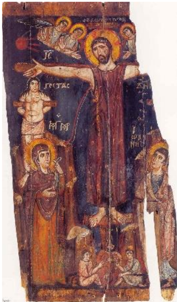
Σπάνια εικόνα της Σταύρωσης (8ος αιώνας). Ιερά Μονή Θεοβαδίστου Όρους Σινά, Αγίας Αικατερίνης.