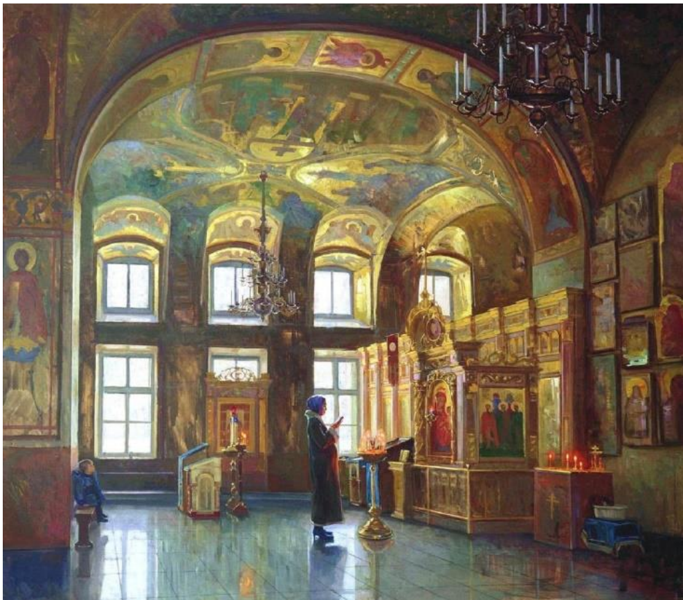
Ντμίτρι Πετρόφ, Η προσευχή της εγκύου, 2005.