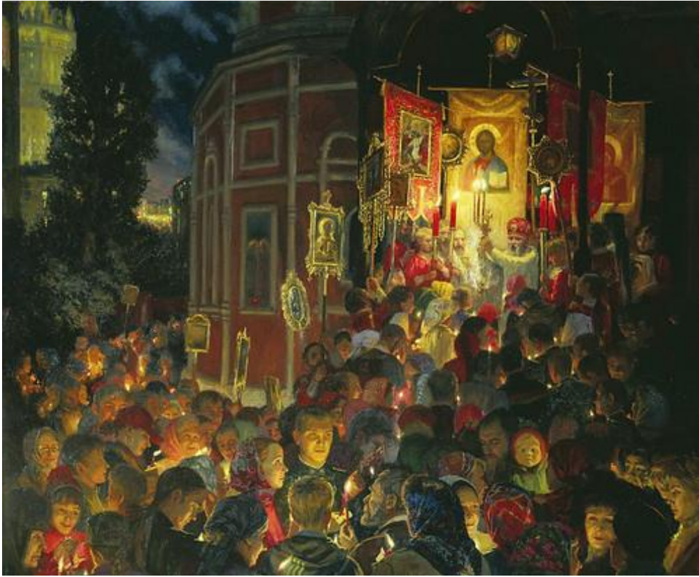
Γιούλα Κουζένκοβα, Πάσχα (2002)