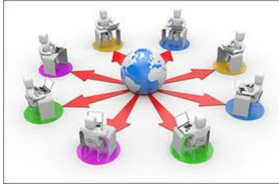
Εικόνα 1: Εκπαίδευση για όλους

Αν το σύνθημα στο 19ο αιώνα ήταν “εκπαίδευση για τους μη έχοντες και μη γνωρίζοντες”, αν το σύνθημα στον 20ο αιώνα ήταν “ακόμα περισσότερη εκπαίδευση για τους μη έχοντες και μη γνωρίζοντες”, το σύνθημα στον 21ο αιώνα θα πρέπει να είναι “προσβάσιμη και ποιοτικότερη εκπαίδευση για όλους”.