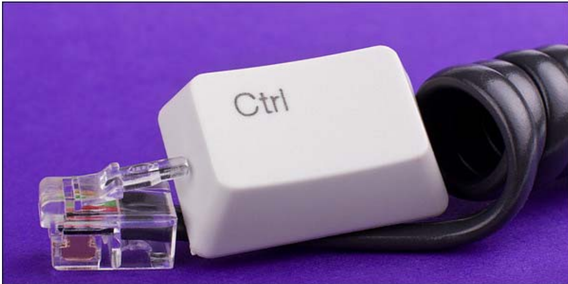
Εικόνα 4: Κλειστότητα στην έκφραση