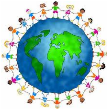
Εικόνα 2: Εκπαίδευση για όλους από παντού

Η διάσταση της ανοικτότητας στο χώρο της ανοικτής και εξ αποστάσεως εκπαίδευσης μπορεί να γίνει κατανοητή μέσα από τον τρόπο οργάνωσης και παροχής του διδακτικού έργου. Πιο συγκεκριμένα, αντί του καθηγητοκεντρικού συστήματος των παραδοσιακών εκπαιδευτικών συστημάτων υιοθετείται το σπουδαστοκεντρικό σύστημα, όπου η έμφαση δόθηκε στην ανεξάρτητη μάθηση από την πλευρά του μαθητή. Ο τελευταίος μελετά το εκπαιδευτικό υλικό στο δικό του χώρο και ανάλογα με το χρόνο, που διαθέτει. Γεγονός που συνεπάγεται την υπέρβαση των γεωγραφικών, των επαγγελματικών και οποιασδήποτε άλλης υφής εμποδίων, τα οποία αντιμετωπίζει ένας μαθητής.