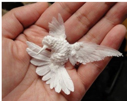
Εικόνα 5: Ελευθερία για όλους

Η ανοικτότητα εξάλλου δεν είναι πανάκεια, ούτε λύνει όλα τα προβλήματα της εκπαίδευσης, ούτε μπορεί να εφαρμοστεί για όλους τους εκπαιδευόμενους, ούτε σε όλες τις μαθησιακές περιστάσεις, αφού οι διδασκόμενοι έχουν διαφορετικών διαβαθμίσεων επιθυμία να αποδεχθούν την ευθύνη της μάθησής τους. Όσο κι αν φαίνεται περίεργο ή ριζοσπαστικό, η υπέρτατη ανοικτότητα στο πλαίσιο της εξ αποστάσεως εκπαίδευσης θα ήταν η δυνατότητα του εκπαιδευόμενου να επιλέγει κατά τη μαθησιακή του πορεία όποια εκπαιδευτική πρακτική επιθυμεί. Τα συστήματα διδασκαλίας και μάθησης στην εξ αποστάσεως εκπαίδευση είναι πιθανόν στο μέλλον να συνδυάζουν πολλαπλούς τρόπους διδασκαλίας.