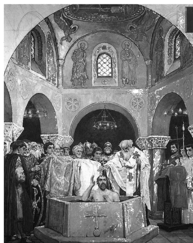
Η βάπτιση του Μέγα Βλαδίμηρου

Λίγα χρόνια αργότερα, ο εγγονός της και διάδοχος Βλαδίμηρος, ο Μέγας, παντρεύτηκε την αδελφή του αυτοκράτορα Βασιλείου Β', Άννα, αφού πρώτα ο ίδιος και πλήθος υπήκοοί του, βαπτίστηκαν Χριστιανοί.