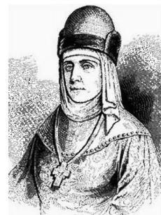
Η Μεγάλη Δούκισσα της Ρωσίας Όλγα