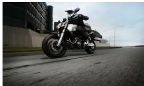
Μοτοσικλέτα που κινείται