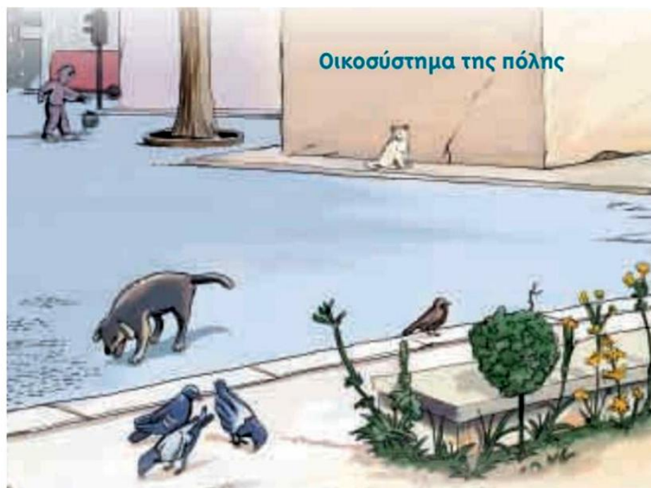
Οικοσύστημα της πόλης