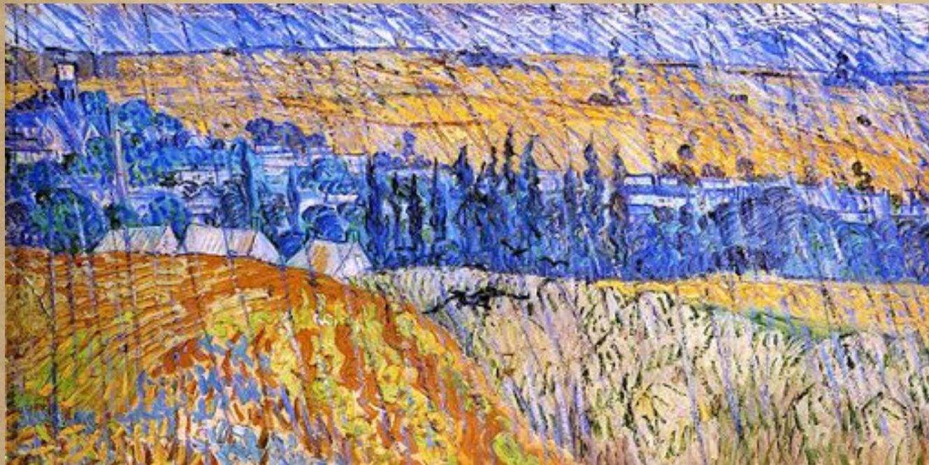
Vincent Van Gogh

Το παράπονο τους όμως δεν βάσταξε για πολύ , αφού μια βροχή δυνατή άρχισε να ξεπλένει τα χρώματα από πάνω τους