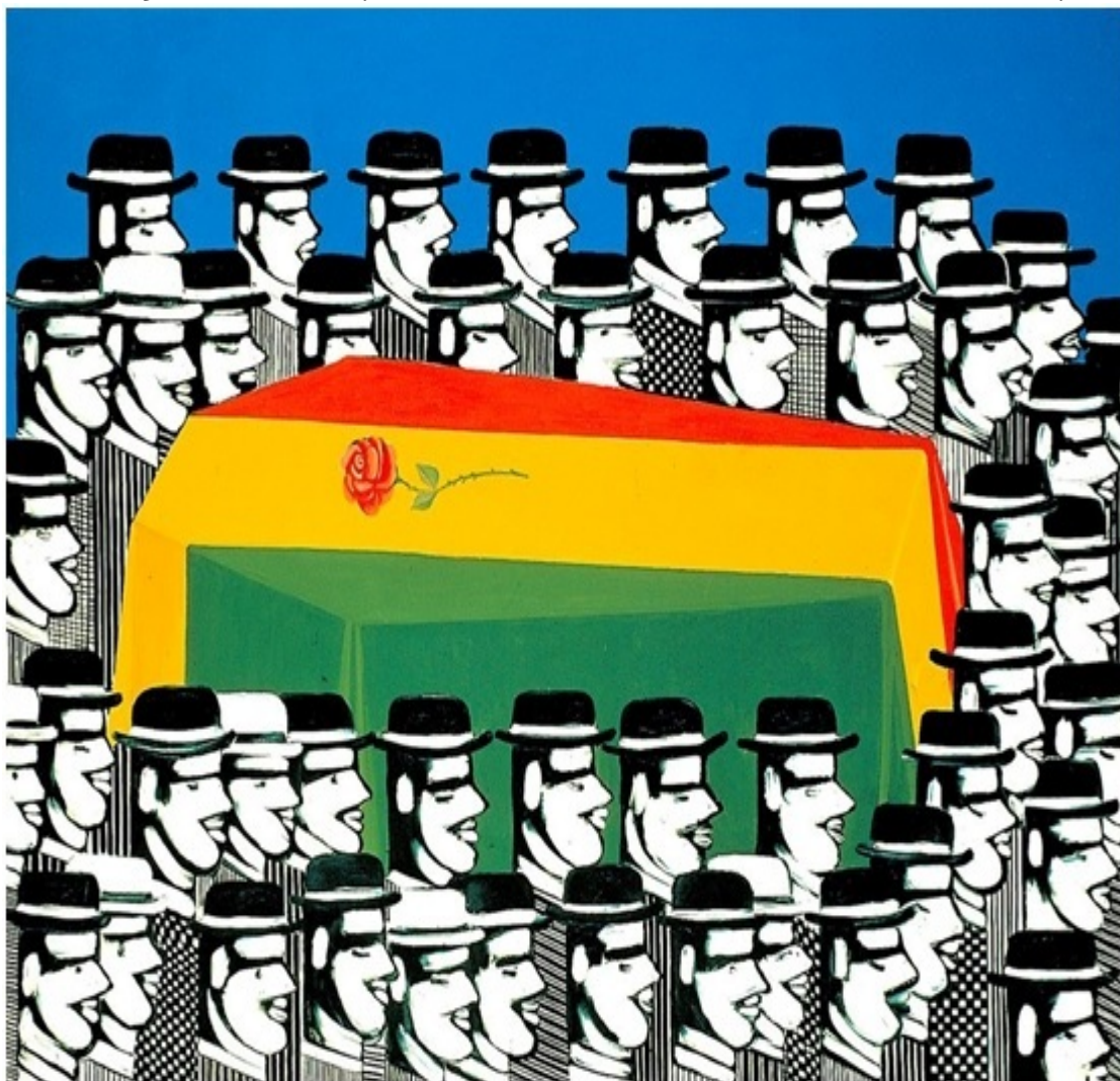
Η κηδεία του Τσε Γκεβέρα (μεταμόρφωση), 1968

Και μαζεύτηκαν άνθρωποι πολλοί και της έκαναν κηδεία λαμπρή!