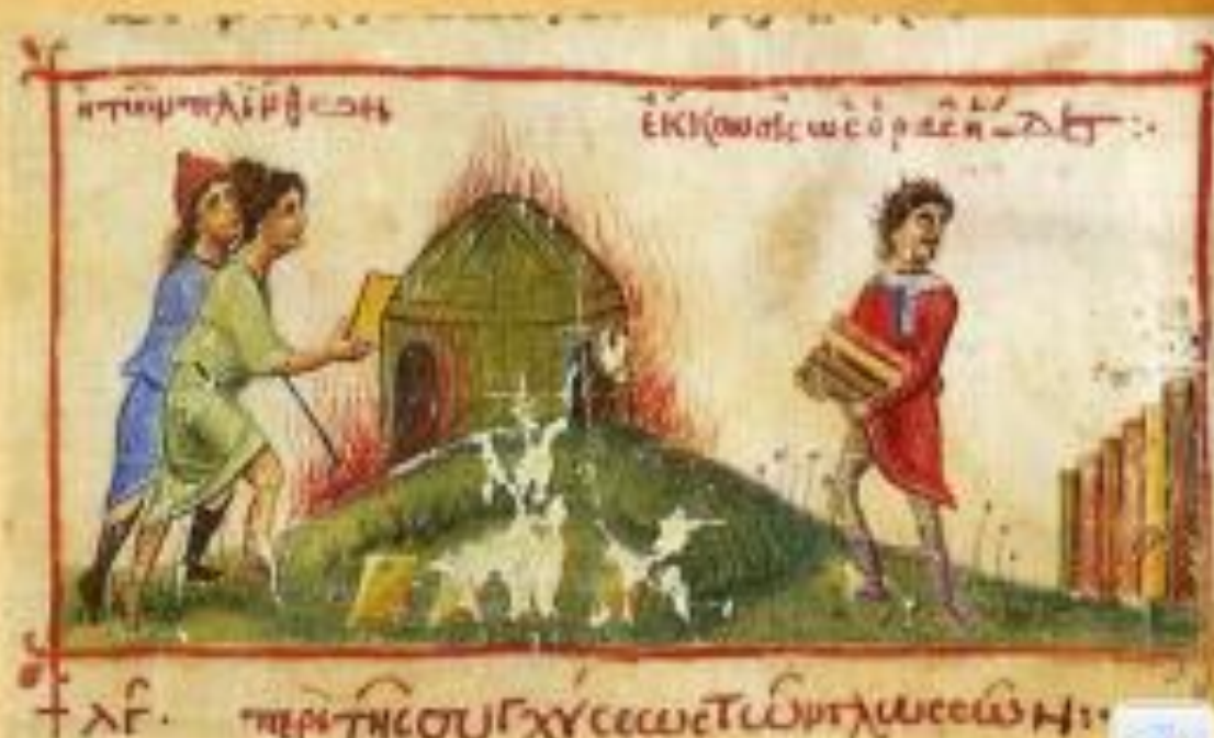
Μικρογραφία σε χειρόγραφο. Το ψήσιμο των πλίνθων. (©Κατάλογος έκθεσης, "Ορες Βυζαντίου") http://exploringbyzantium.gr