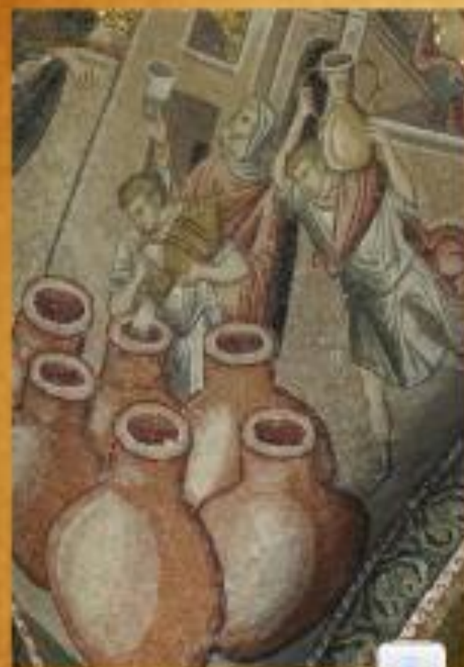
Ψηφιδωτό. Τουρκία, Κωνσταντινούπολη, Μονή της Χώρας, Αναπαράσταση πιθαριών. (©Φωτογραφικό Αρχείο ΕΚΒΜΜ) http://exploringbyzantium.gr