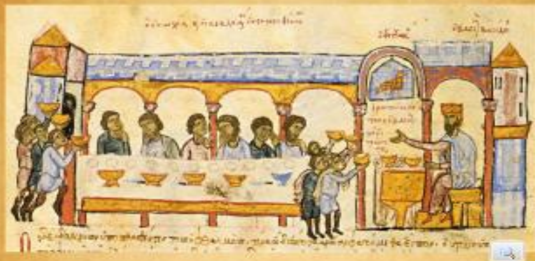
Μικρογραφία σε χειρόγραφο. Αναπαράσταση βυζαντινού παλατιού. (©Σύνοψις Ιστοριών Ιωάννου Σκυλιτζη, Ισπανία, Μαδρίτη, Εθνική Βιβλιοθήκη http://exploringbyzantium.gr