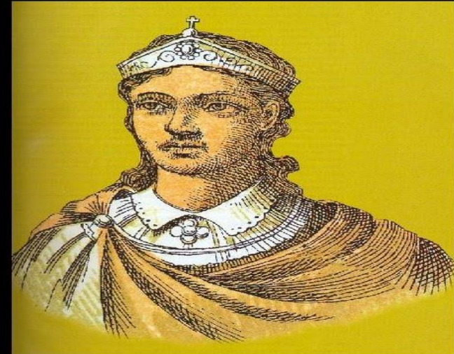
Κων/νος Ζ' ο Πορφυρογέννητος(912- 959)