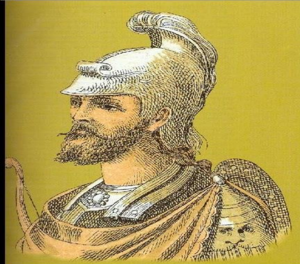
Λέων ΣΤ' ο Σοφός(886- 912)