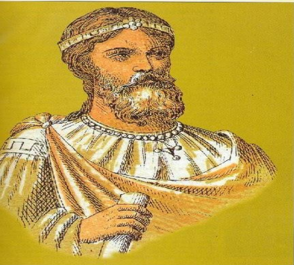
Βασίλειος Α' ο Μακεδών(867-886)