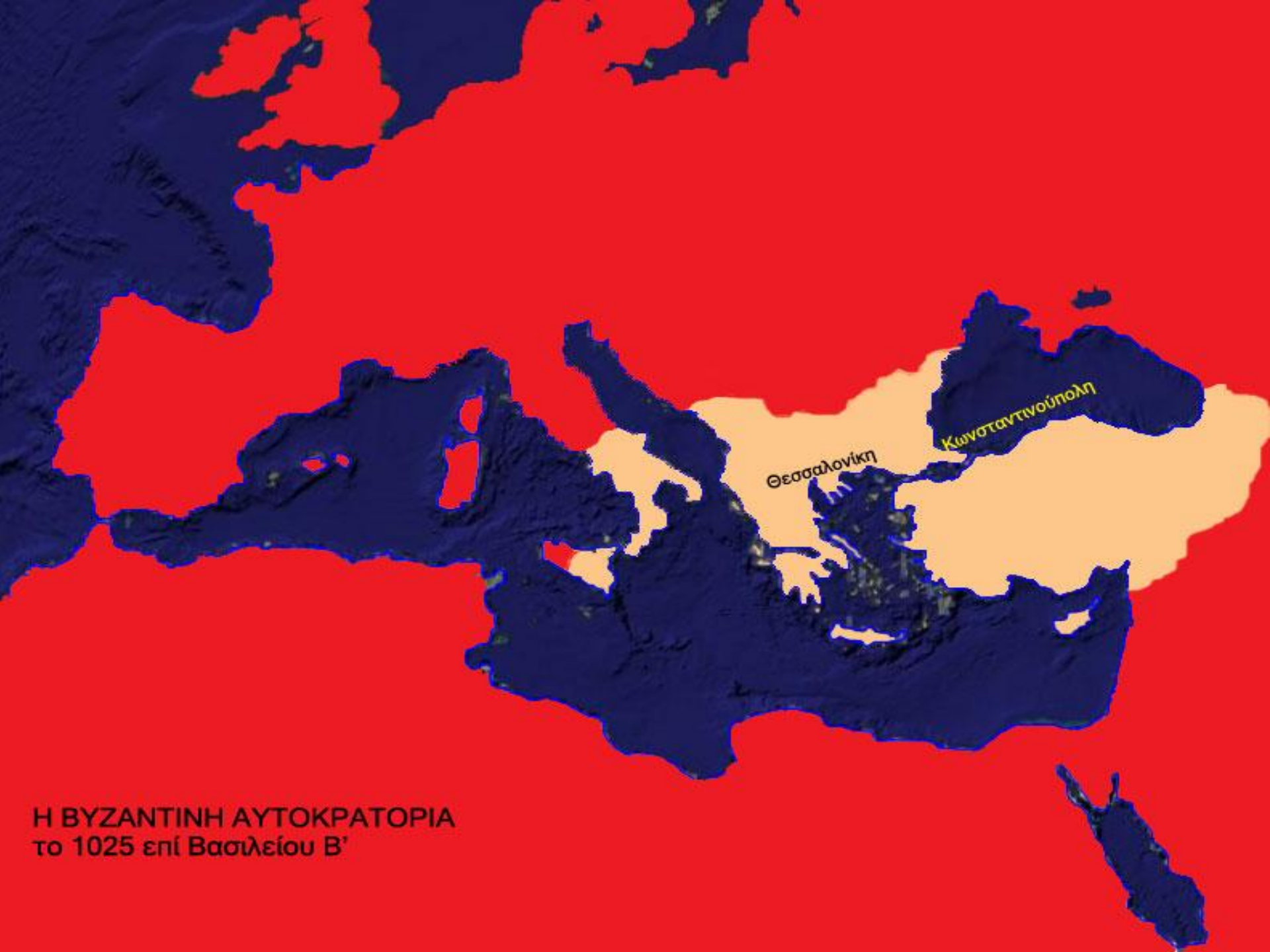
Η ΒΥΖΑΝΤΙΝΗ ΑΥΤΟΚΡΑΤΟΡΙΑ το 1025 επί Βασιλείου Β΄