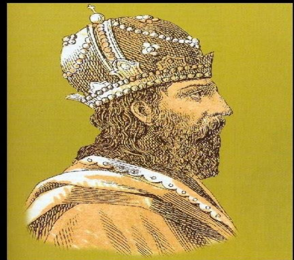
Νικηφόρος Φωκάς(963- 969)