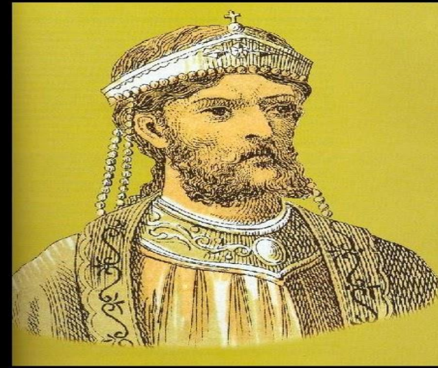
Βασίλειος Β' ο Βουλγαροκτόνος(976- 1025)