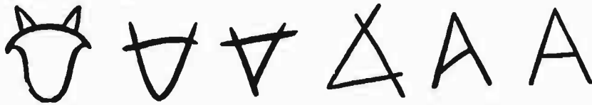
Ἐξελίξεις τοῦ σχήματος τοῦ ἄλφα ἀπό τό σχῆμα τῆς κεφαλῆς βόδι.

ΙΣΤΟΡΙΚΗ ΑΝΑΣΚΟΠΗΣΙΣ: Τό γράμμα τούτο εἶναι τό ἀρχικόν οὐ μόνον τοῦ Ἑλληνικοῦ ἀλφάβητου ἀλλά καί ὄλων τῶν γνωστῶν ἀλφάβητων. Τό ὄνομά του κατά τήν Φοινικίην περίοδον ὠμοίαζε πρός τό Ἑβραϊκόν ὄνομα aleph , εἰς δὲ τήν Ἑλληνικήν παρελήφθη ὑπό τό ὄνομα ἄλφα (διότι, ὡς γνωστόν, τὰ ὄνόματα τῆς Ἑλληνικῆς λήγουν εἰς φωνήεν καί ἐκ τῶν συμφῶνων μόνον εἰς -ν, -ρ, -σ). Ἐσημαίνει δὲ ἡ λέξις ἄλεφ «βῶδι». Καί πράγματι ἄν ἀντιστρέψωμεν τό κεφ. Α ἢ γράψωμεν πλαγίως τό μικρόν α, βλέπομεν ὅτι τὰ δύο σχήματα ∇ ∇ ἀποτελοῦν γραμμικάς παραστάσεις κεφαλῆς βόδι μετὰ κεράτων. Δέν πρέπει δὲ νά λησμονῶμεν, ὅτι τὰ πρῶτα γράμματα ἦσαν σχήματα ζῶων ἢ ἄλλων φυσικῶν ἀντικειμένων, ἐξελιχθέντων κατὰ μικρόν εἰς χονδροειδέη σκίτσα τῶν ἰδίων μορφῶν. Εἰς τό Φοινικικόν ὄμως ἀλφάβητον τό γράμμα τούτο δέν παρίστα φωνήεν, ὅπως εἰς τό Ἑλληνικόν, ἀλλά σύμφωνόν τι ἢ πνεῦμα· διότι τό Φοινικικόν ἀλφάβητον, ὅπως καί ὄλα τὰ Σημιτικά, δέν εἶχεν ἰδιαιτέρα σύμβολα διά τὰ φωνήεντα. Ἄλλ' ἢ ἄποψις, ὅτι οἱ Ἕλληνες παρέλαβον τό ἀλφάβητον κατ' εὐθείαν παρὰ τῶν Φοινικίων, ἔχει ἀρχίσει νά χάνη ἐδάφος. Εἶναι δυνατόν, ἐπομένως, τό γράμμα τούτο νά παρίστα φωνήεντα φθόγγων καί προτοῦ παραληφθῆ ὑπό τῶν Ἑλλήνων.